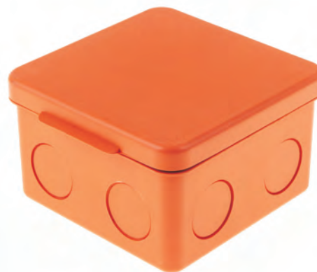
СЗВ80 Нг, оранжевый