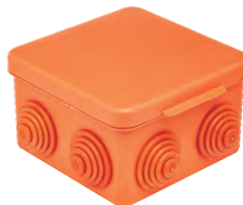
СЗВ87 Нг, оранжевый