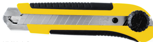
КМУ-1-R арт. 50195