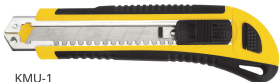
КМУ-1 арт. 49619