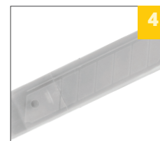
удобный кейс для хранения