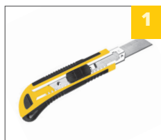
автоматическая смена лезвий

Материал лезвий сталь У8 Материал рукоятки пластик, резина Цвет рукоятки черный/желтый