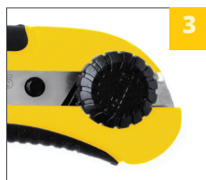
надежная фиксация лезвия