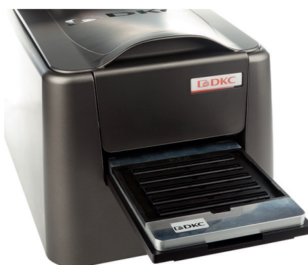
Установить адаптер на направляющие