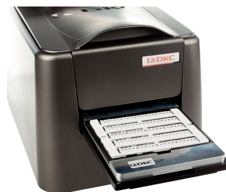
Установить маркировочный материал