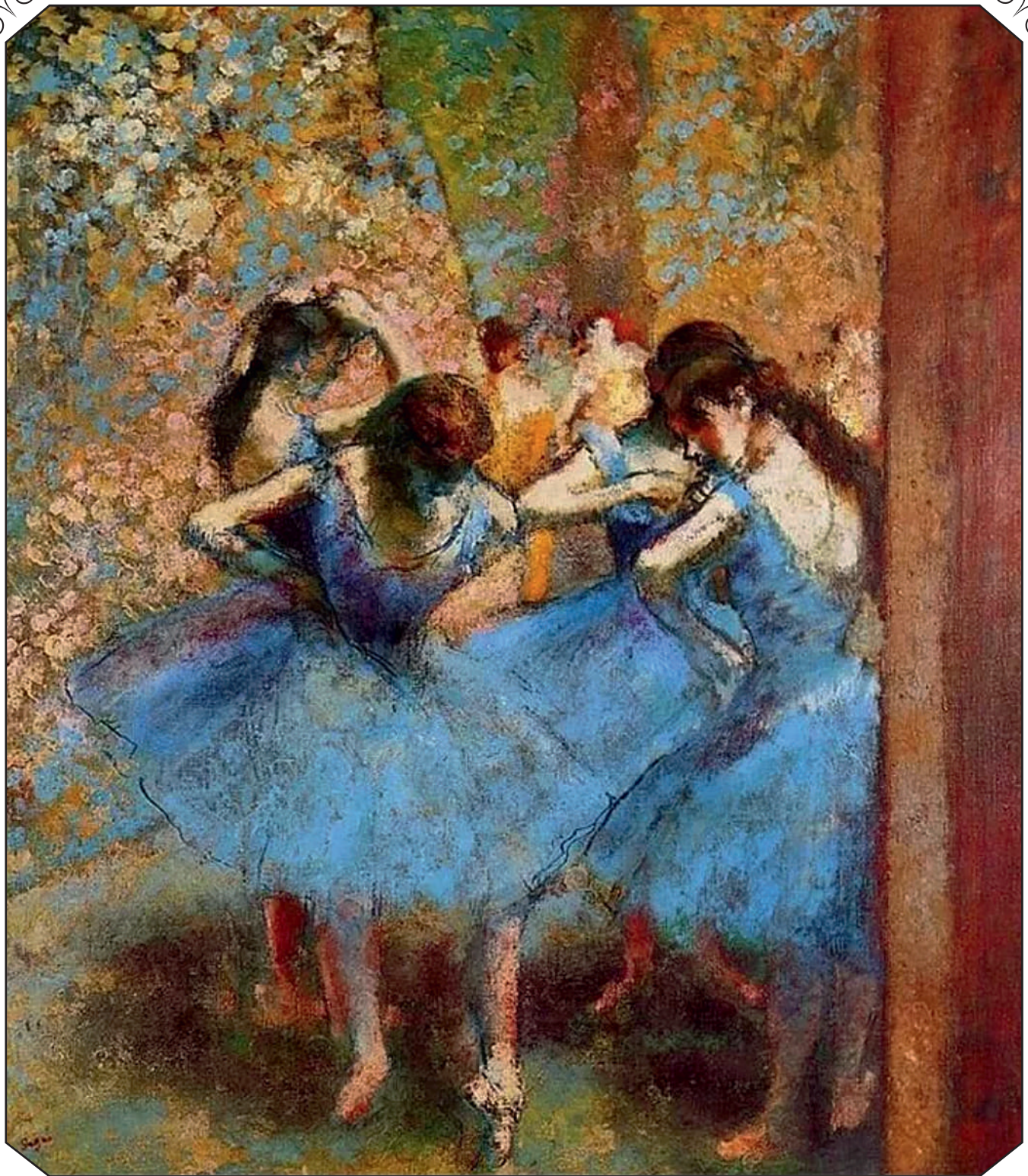
Эдгар Дега Танцовщицы (1834–1917) Edgar Degas Dancers