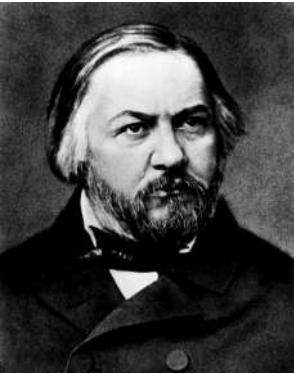
М. И. Глинка 1804–1857