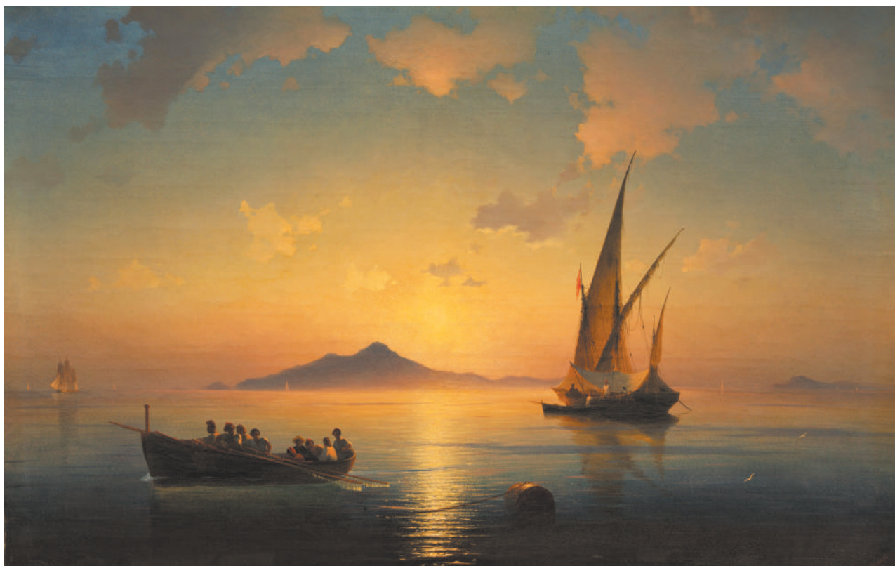
И. К. Айвазовский Неаполитанский залив [фрагмент]

Италию называют родиной замечательных певцов и красивых песен. Неаполитанская песня «Санта Лючия» — одна из самых известных. Она воспевает красоту родной природы.