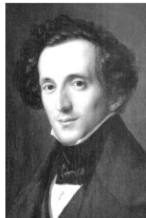
Ф. Мендельсон 1809–1847

Название цикла фортепианных пьес немецкого композитора Феликса Мендельсона — « Песни без слов » — указывает на особую выразительность, певучесть мелодий.