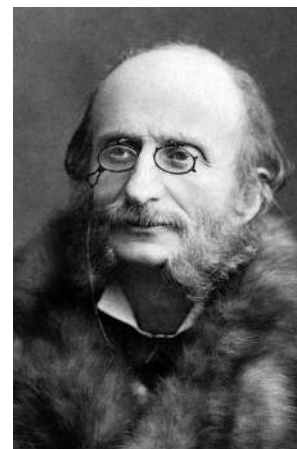
Ж. Оффенбах 1819–1880

В Италии любят не только петь, но и танцевать. Один из знаменитых итальянских танцев — тарантелла . Он ведёт свою историю с XV века и окружён множеством легенд. Считалось, что только быстрая тарантелла способна излечить человека от укуса ядовитого паука тарантула. Танцевать надо было до изнеможения, кружась и прыгая во всё более ускоряющемся темпе. Но это легенда... А танец жил и живёт своей жизнью. Тарантеллу, как и баркаролу, можно по праву считать музыкальными символами Италии.