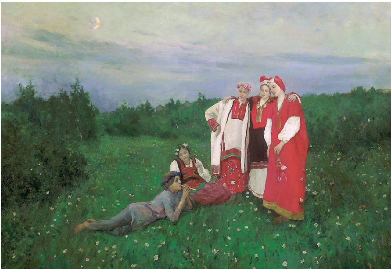
К. А. Коровин Северная идиллия [фрагмент]

Собрались вместе девушки. Вот одна из них запела выразительную мелодию. К ней присоединились другие. Сейчас они не заняты работой, не водят хоровод, не пляшут... Они просто поют. О красоте родной природы, о глубине человеческих чувств, непростой судьбе. Такие песни называются лирическими .