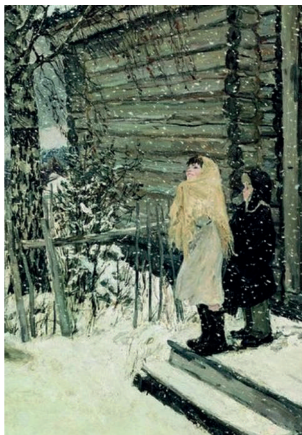
А. А. Пластов Первый снег [фрагмент]