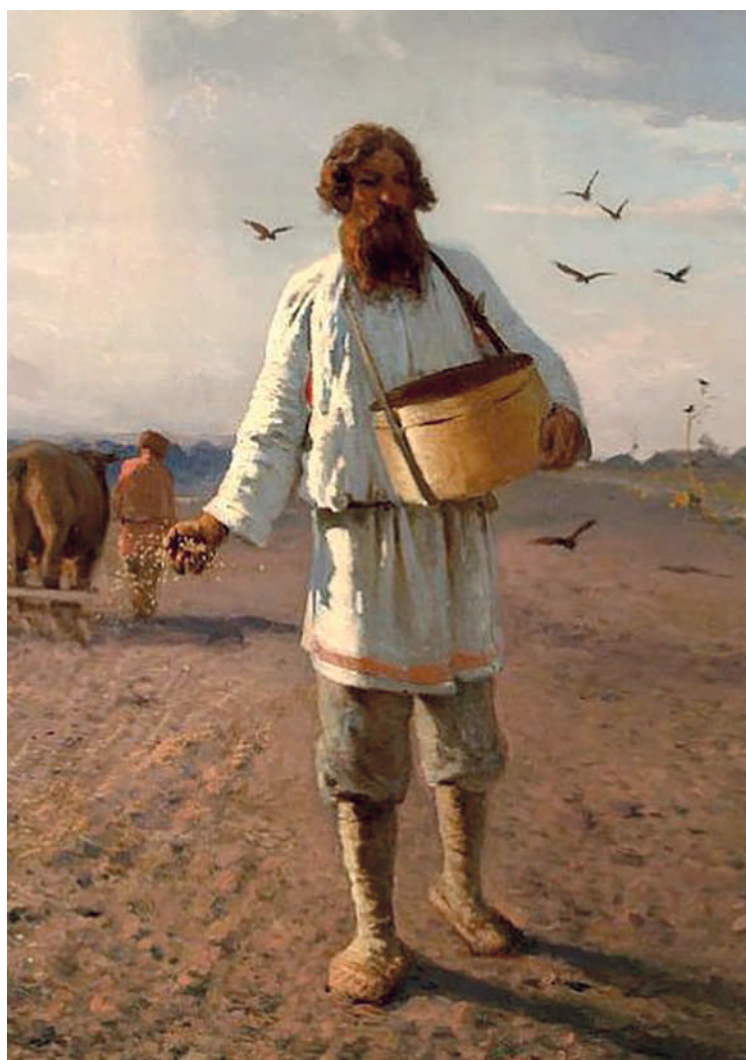
Г. Г. Мясоедов Сеятель

Что изображается в аккомпанементе в начале песни?