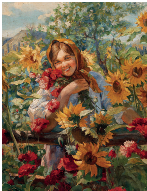
Ф. В. Сычков Мордовская девушка [фрагмент]