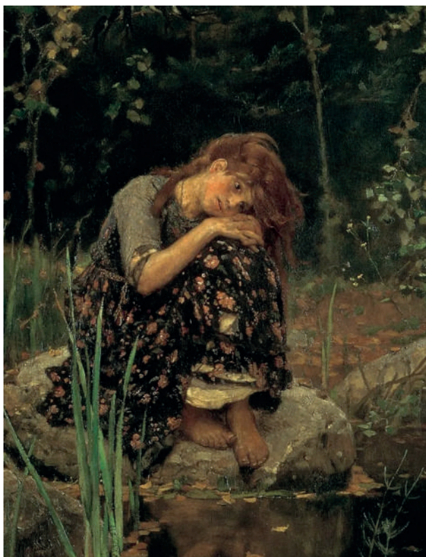
В. М. Васнецов Алёнушка [фрагмент]