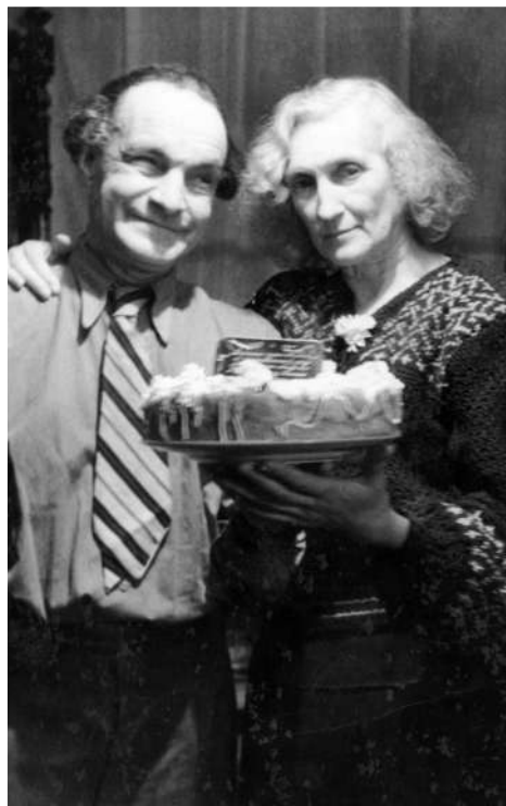
Дедушка с бабушкой 50 лет спустя (юбилей)

Они были знакомы с детства. Дед влюбился в бабушку, Ека-