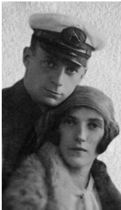
Свадебная фотография мамы и папы (1933 г.)