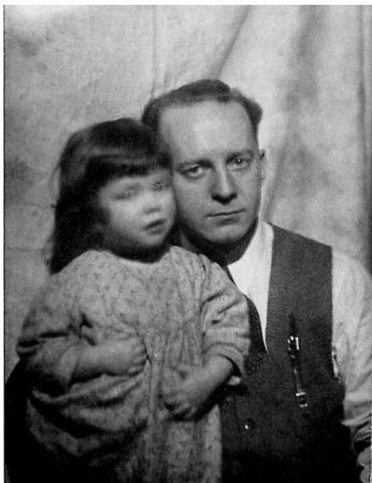
Я с папой

Работал отец инженером по технике безопасности, читал лекции. Обладая светлой головой и неуживчивым характером, он постоянно нарывался на неприятности. Однажды, выражая несогласие с решением какой-то технической проблемы, он