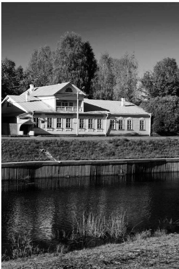
Дом в Тихвине, где родился Римский-Корсаков

ментарии к «Летописи»). В связи с этим напомним, что мемуары создавались на протяжении тридцати лет (!), иногда с длительными перерывами. Самая большая ценность «Летописи» заключается в том, что перед читателем предстает не только жизненный и творческий путь автора, но также и очень интересная летопись музыкальной и общественной жизни России во второй половине XIX — начале XX века.