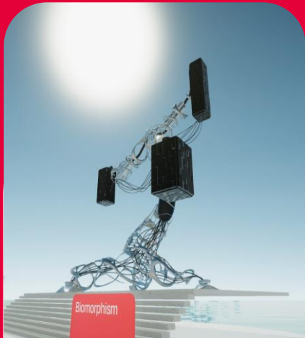
«Biomorphism», Кирилл Контре