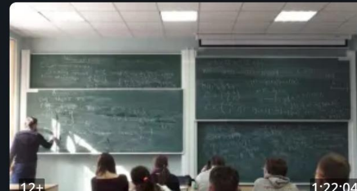
Алгебра. Лекция 88