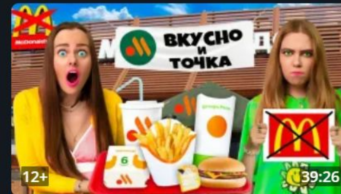
СКУПАЮ ВСЕ МЕНЮ ВКУСНО и ТОЧКА за 24 ЧАСА Челлендж ЭТ...