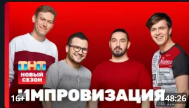
Импровизация: премьерный выпуск нового сезона