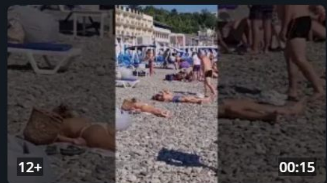
Спорт - всегда и везде! Даже на отдыхе