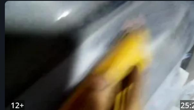
Одновременный ремонт двух автомобилей.Покраска битого...