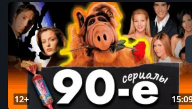
Сериалы, которые мы смотрели в 90-е