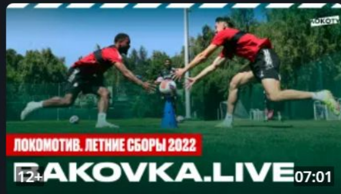
ВАКОВКА LIVE // Третья неделя сборов