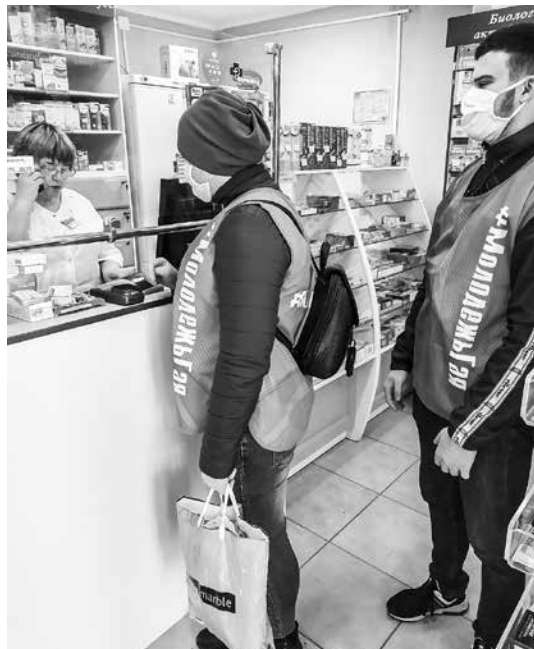
Закупка необходимых лекарств

- Я узнал из информации молодежной палаты Гайского городского округа, что требуются добровольцы. Так я и решил подать свою анкету и стать волонтером программы. Когда начали выполнять первые заявки, сразу стало понятно, что мы это делаем