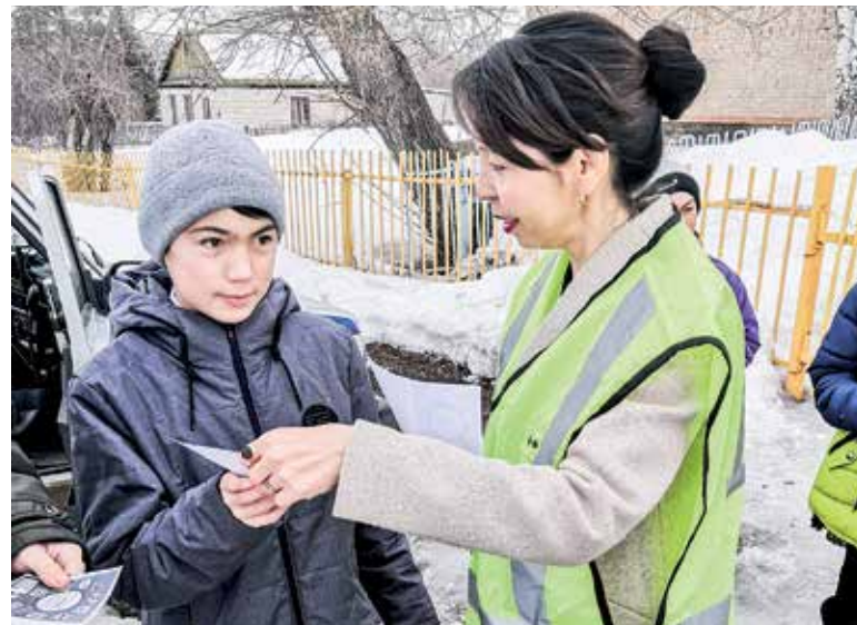
Главное – соблюдайте правила

сотрудниками были привлечены к административной ответственности три водителя, которые осуществляли организованные перевозки групп детей.