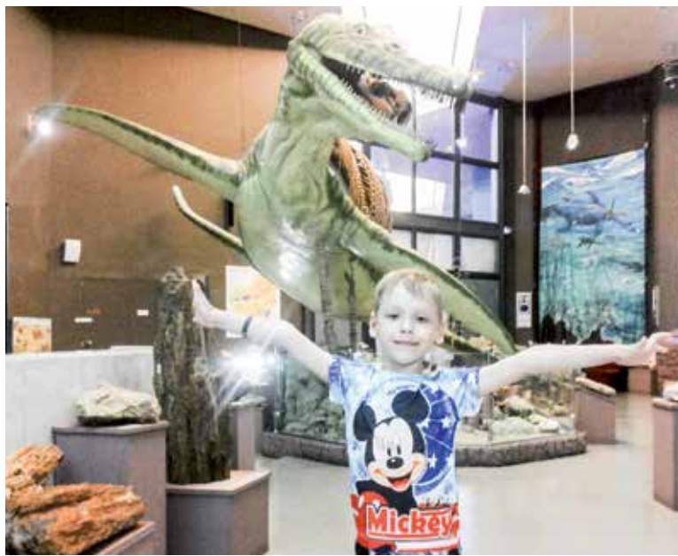
Самая удивительная выставка музея имени П.В. Алабина – палеонтологическая