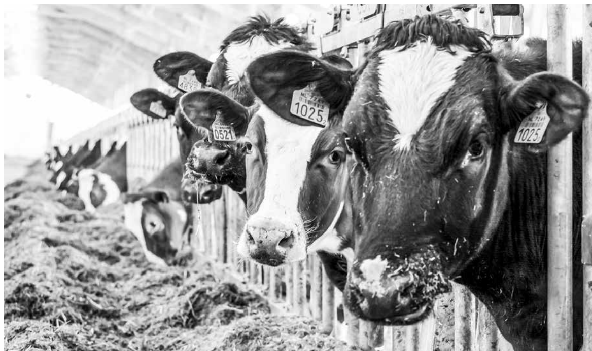
В хозяйствах Оренбуржья насчитывается 543 тысячи голов КРС

– В настоящий момент запасы минеральных удобрений составляют 106 процентов от планируемого объема, что гораздо выше уровня аналогичного периода прошлого года. Всего приобрете-