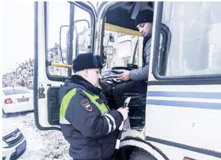
Рейд по «школьным» автобусам

гивайтесь сами и просите пристегнуться своих пассажиров. Перевозите детей только в автокреслах или используя специальные удерживающие устройства».