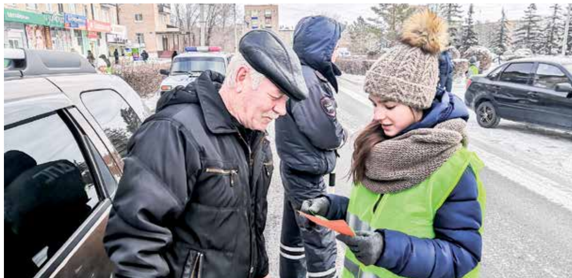
Школьники вышли помочь сотрудникам ГИБДД

живающие устройства. Водители, вы же тоже родители!»