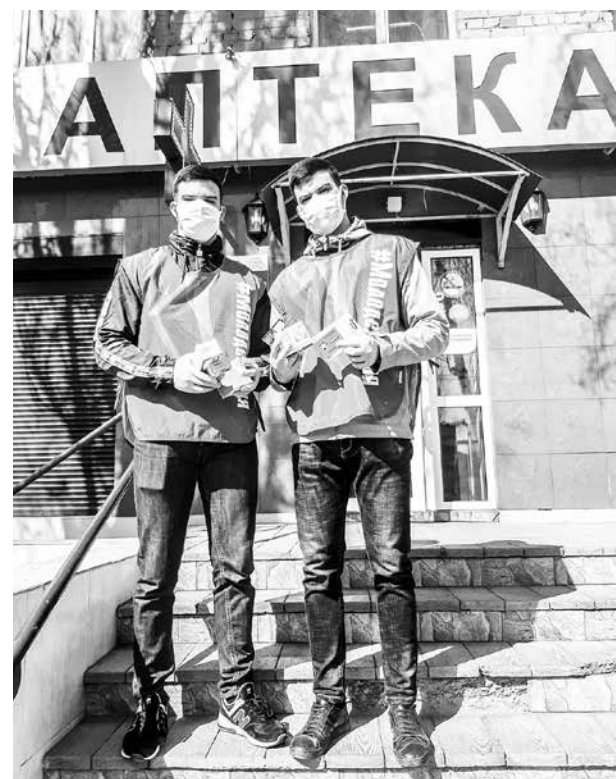
Вот так выглядят наши добровольцы