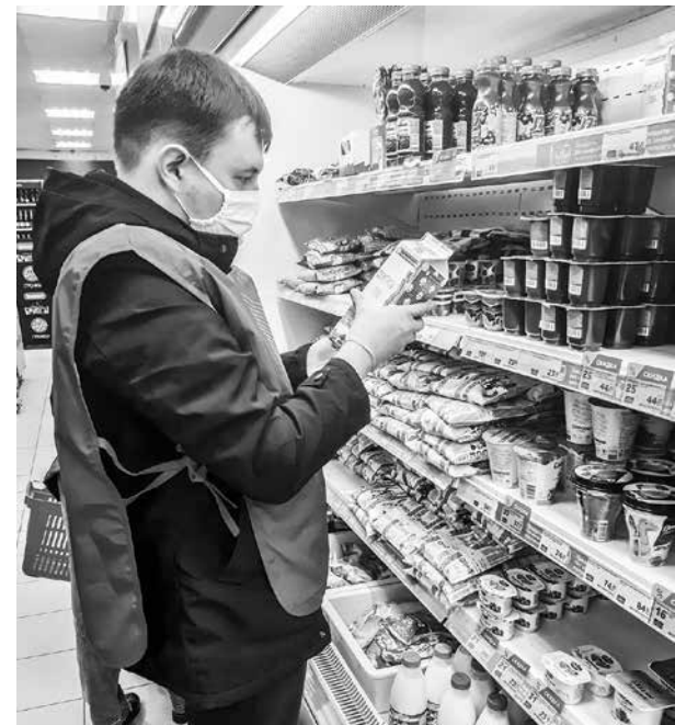
Добровольцы покупают продукты строго по списку