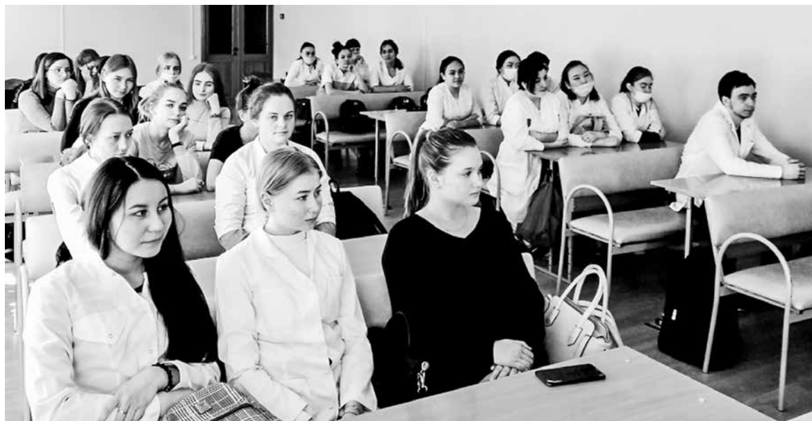
Студенты Гайского филиала Орского медицинского колледжа беседуют о взаимоотношении Церкви и молодежи