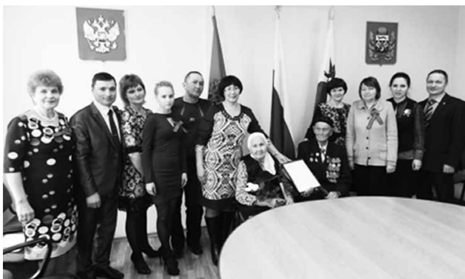
Фото на память после вручения свидетельства о предоставлении социальной выплаты на приобретение жилья

После демобилизации прадедушка продолжил трудовую деятельность в школе родного села до 1958 года. И затем после окончания Уральского педагогического института был переведен учителем географии, а затем на-