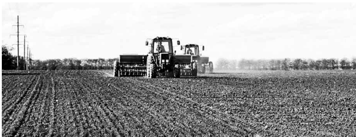
В нынешнем году земледельцам предстоит засеять яровыми 3 миллиона 232 тысячи гектаров

– Средства государственной поддержки должны работать на развитие агропромышленного комплекса. Получая субсидии по тому или иному виду поддержки,