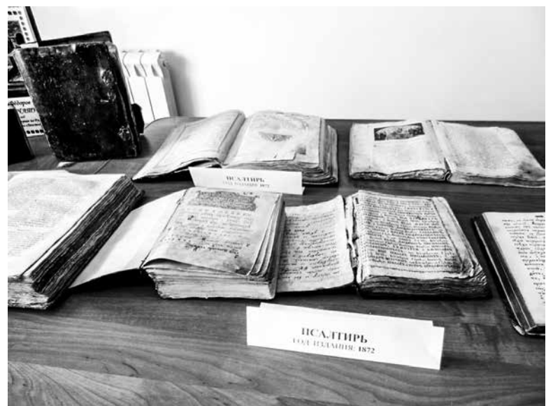
Книги из фонда библиотеки Петропавловского храма