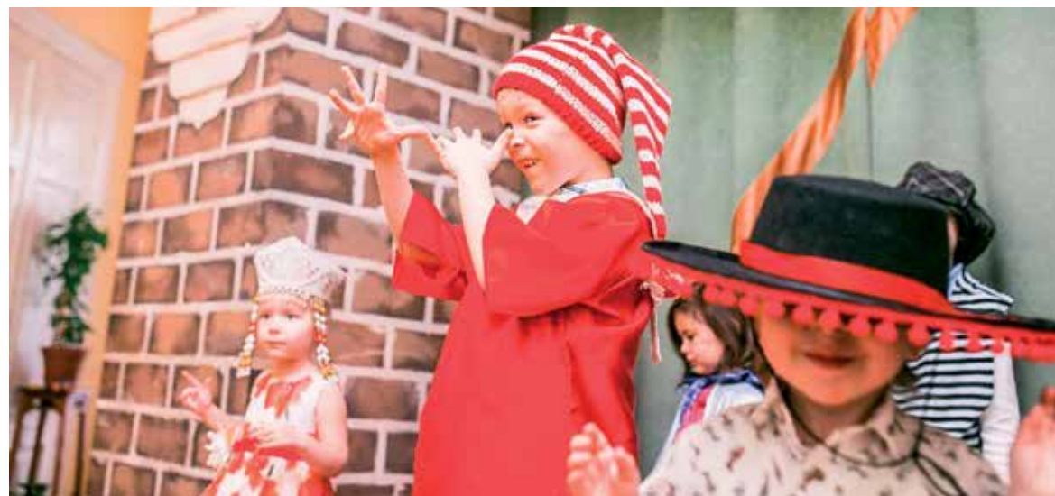
Совершенно неожиданно попали на выставку-квест «Приключение с Буратино»

рой половине 20 века и современности. Здесь внимание привлекает панорама военных действий в Чечне с детальной проработкой зданий и нанесенных разрушений, военное обмундирование представителей разных родов войск и настоящие образцы оружия, которые можно подержать в руках и сфотографировать с ними на память. Шестилетнему ребенку, чтобы удержать автомат в руках, пришлось для сохранения равновесия основательно отклониться назад.