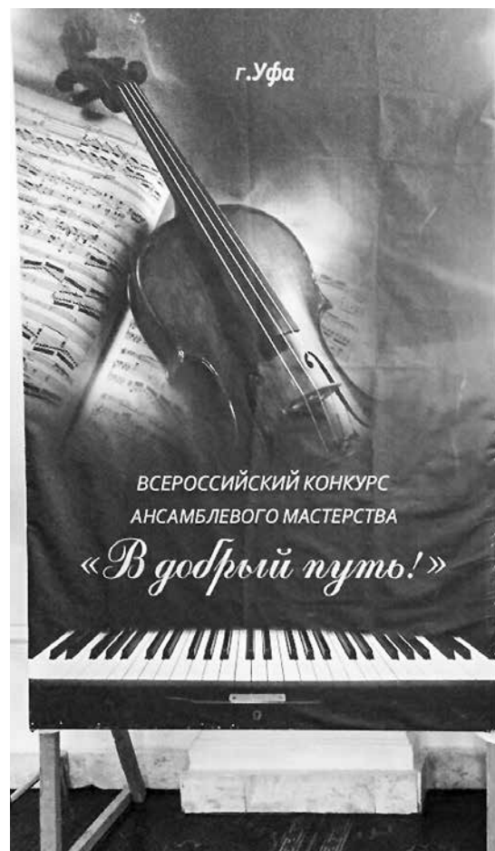
На Всероссийском конкурсе в г. Уфа