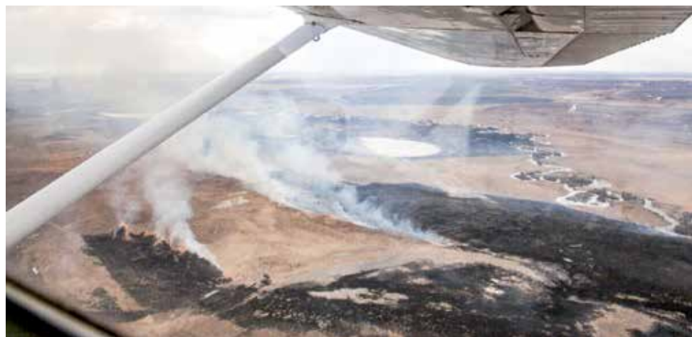
Как быстро распространяется огонь