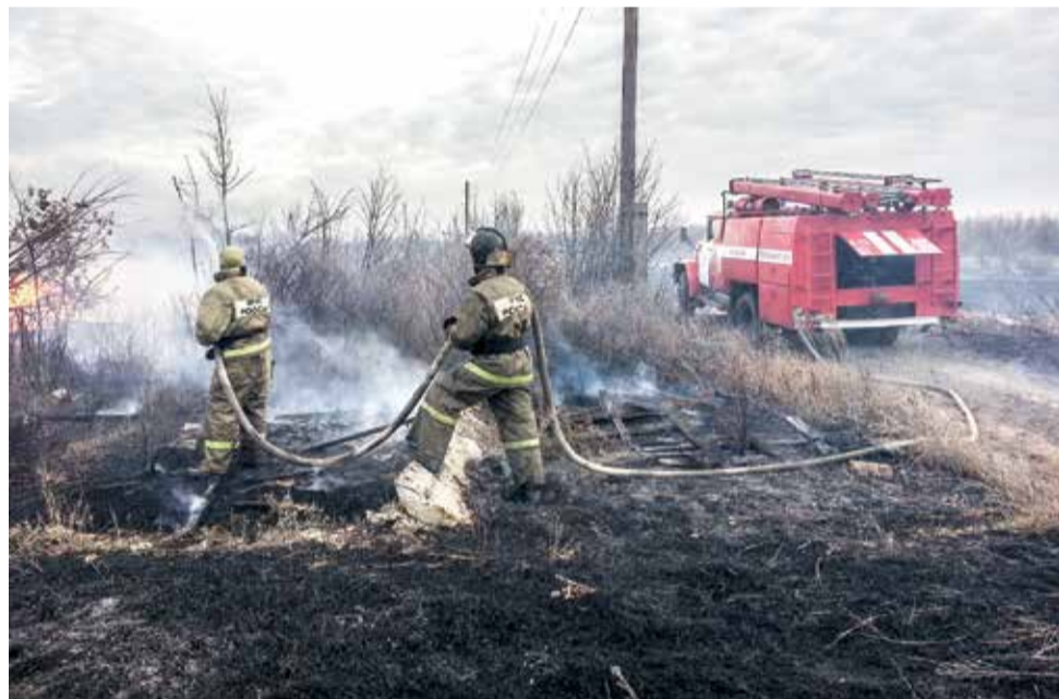
И снова горела степь