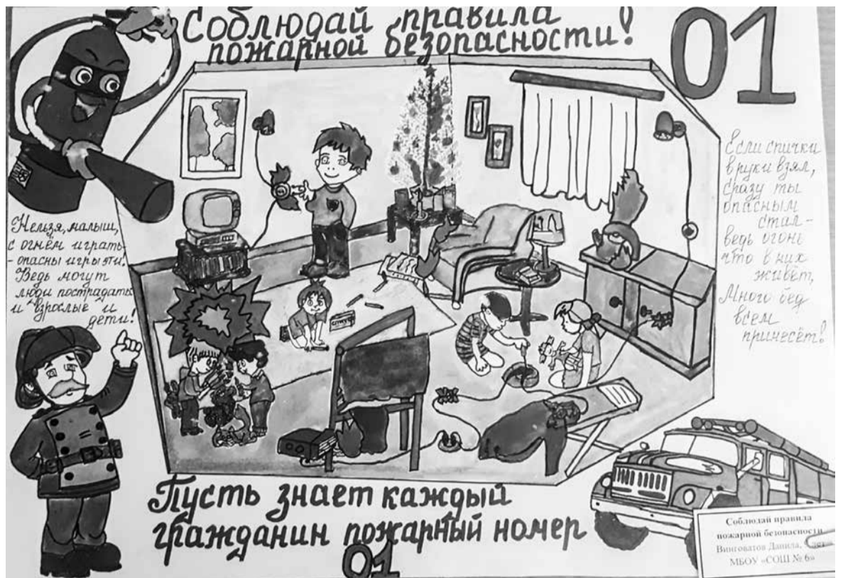
Мы за безопасное детство

Руководители творческих объединений, которым специфика занятий позволяет проводить их в удаленном режиме, с начала изоляции продолжают работу с детьми. На сайте центра публикуются ежедневно задания, мастер-классы, разработанные педагогами для самостоятельного выполнения.