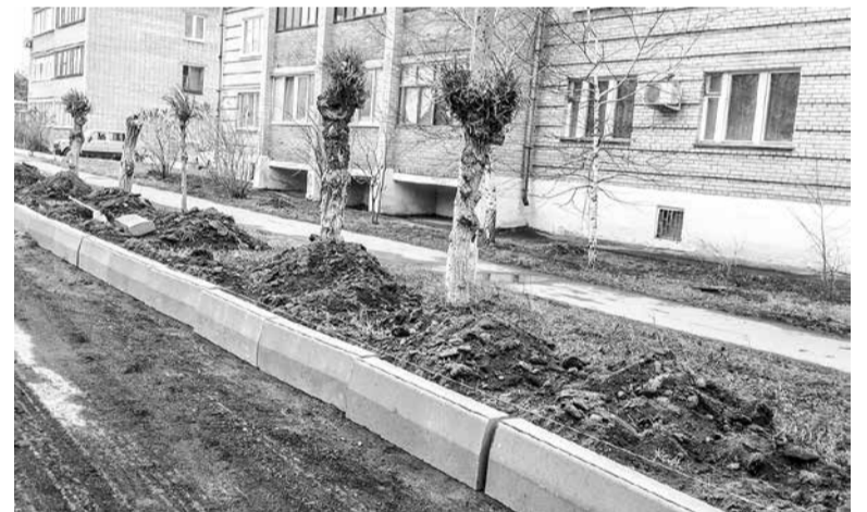
Ремонт дороги ул. Молодежной в г. Гае