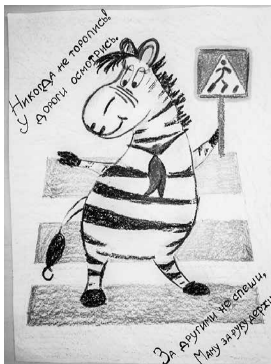
Никогда не торопись!