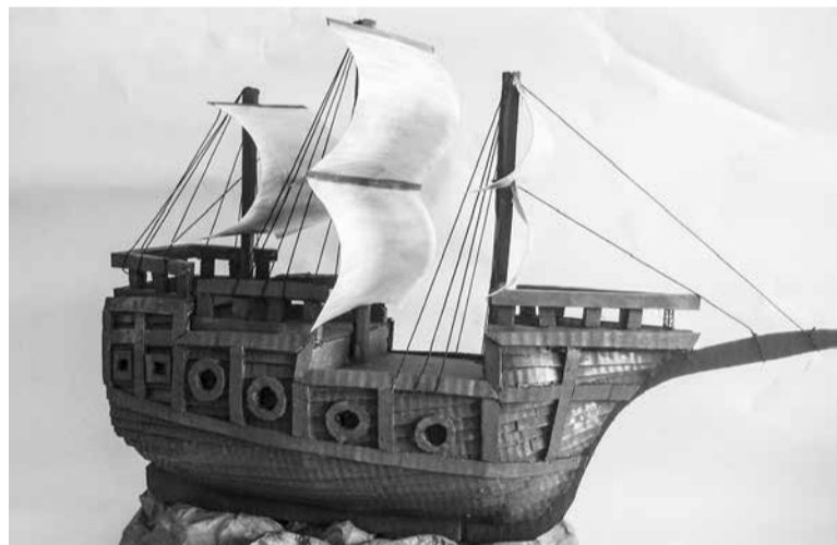
Конкурсанты проработали каждую деталь