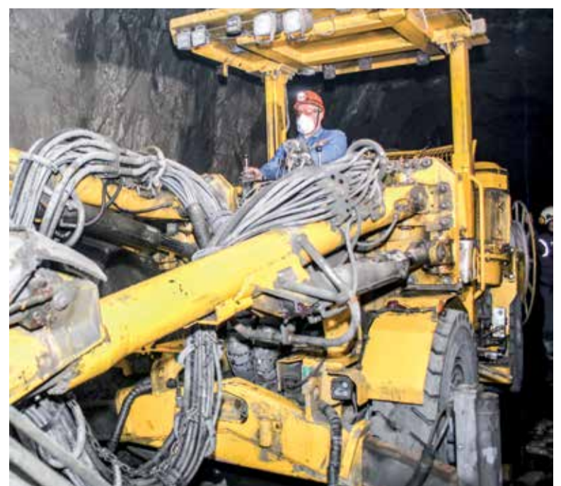
Двухстреловая буровая проходческая установка