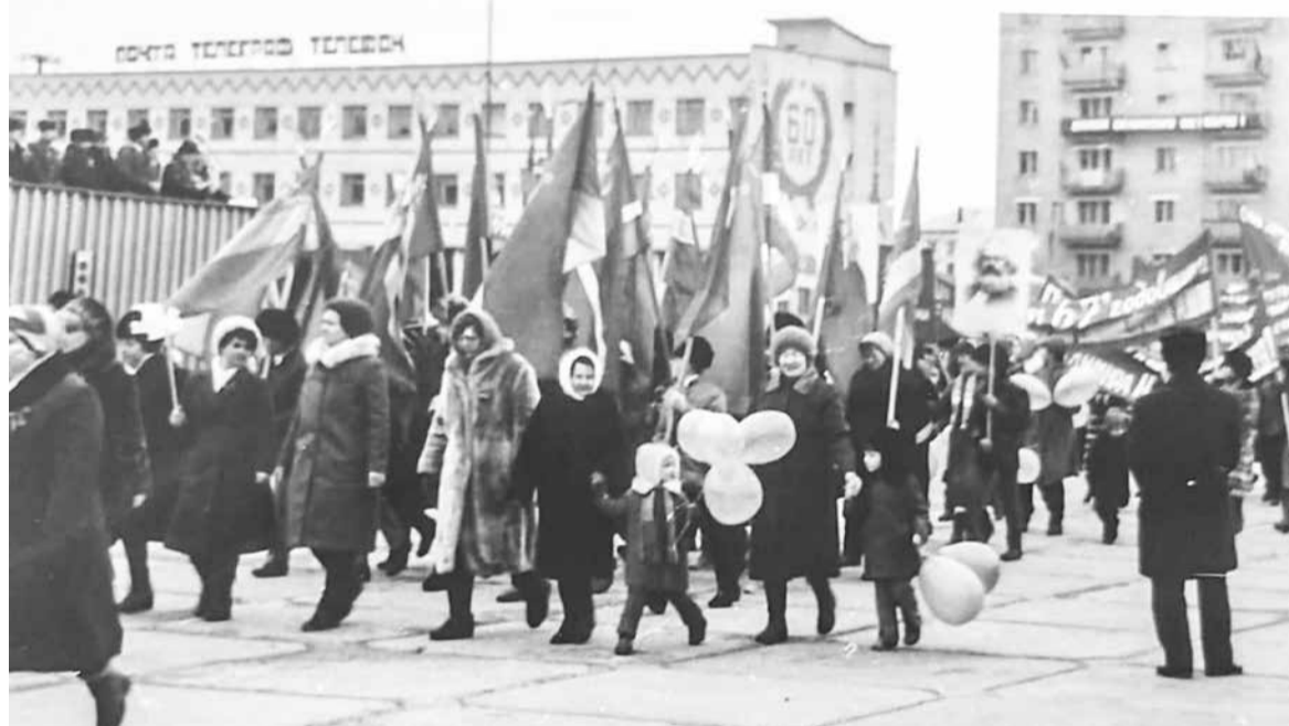
Демонстрация 7 ноября. Идет школа №1

И сына не пришлось увидеть живым. Но и погибшего не смогла мать предать земле: убит 28 августа 1944 года у деревни Аудия в Румынии, похоронен в лесу на поляне, сообщается в похоронке.