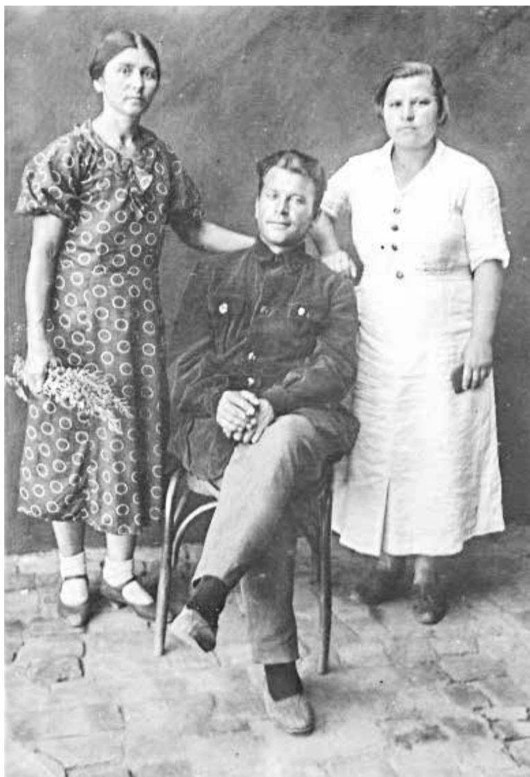
Фото перед самой войной