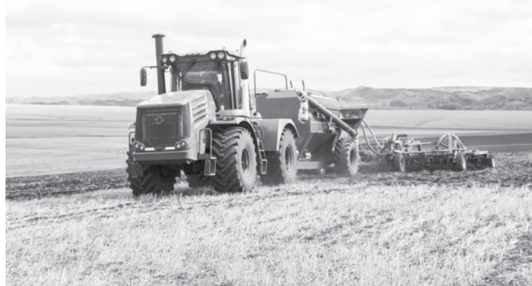
Идет сев яровых