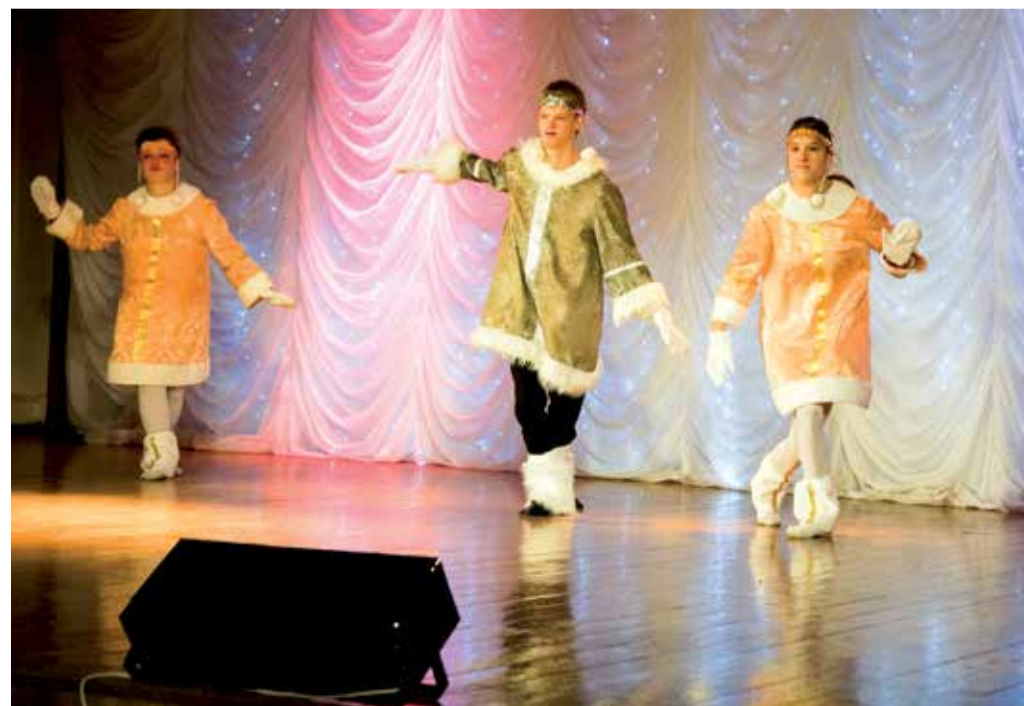
Выступление после долгих репетиций