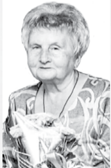
Родные. №239 (1-1).

Ты не считай года свои, родная, Хотя воды немало утекло. Всю жизнь, усталости не зная, Нас согреваешь ласковым теплом. Пускай судьба тебя не баловала, Как было трудно, знаешь ты одна, Но не сдавалась ты, не унывала, Все нам сполна ты отдавала. Спасибо, милая, родная За то, что ангел твой хранит от бед, За доброту, любовь и всепрощение, За то, что с нами ты всегда душой! Мы пожелать тебе хотим здоровья, Чтобы на все тебе хватало сил, Чтоб каждый день наполнен был любовью И только радость в дом твой приносил!