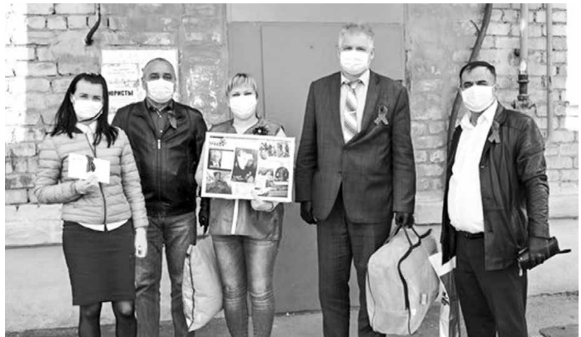
Представители администрации Гайского городского округа, бизнеса и «Волонтеры Победы» посетили ветеранов войны на дому