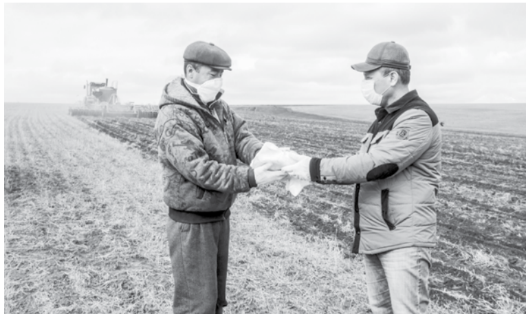
Даже в поле главное – безопасность людей