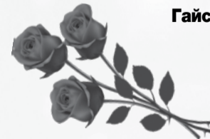
Совет ветеранов Гайского городского округа.

Пусть будут светлыми года И все исполнятся желанья. Здоровья, радости всегда, Счастливой жизни, процветанья.