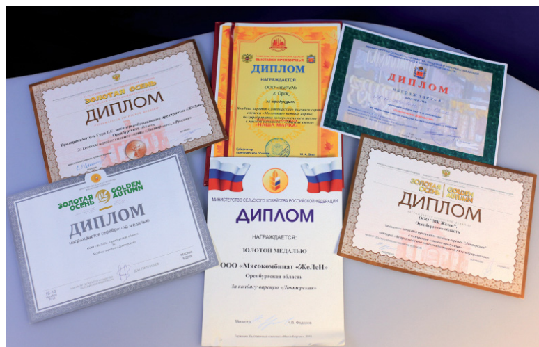
О высоком уровне продукции свидетельствуют многочисленные награды