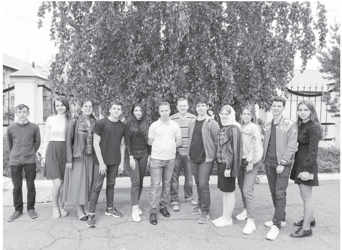
Представители молодежного отдела Гайского благочиния Орской епархии