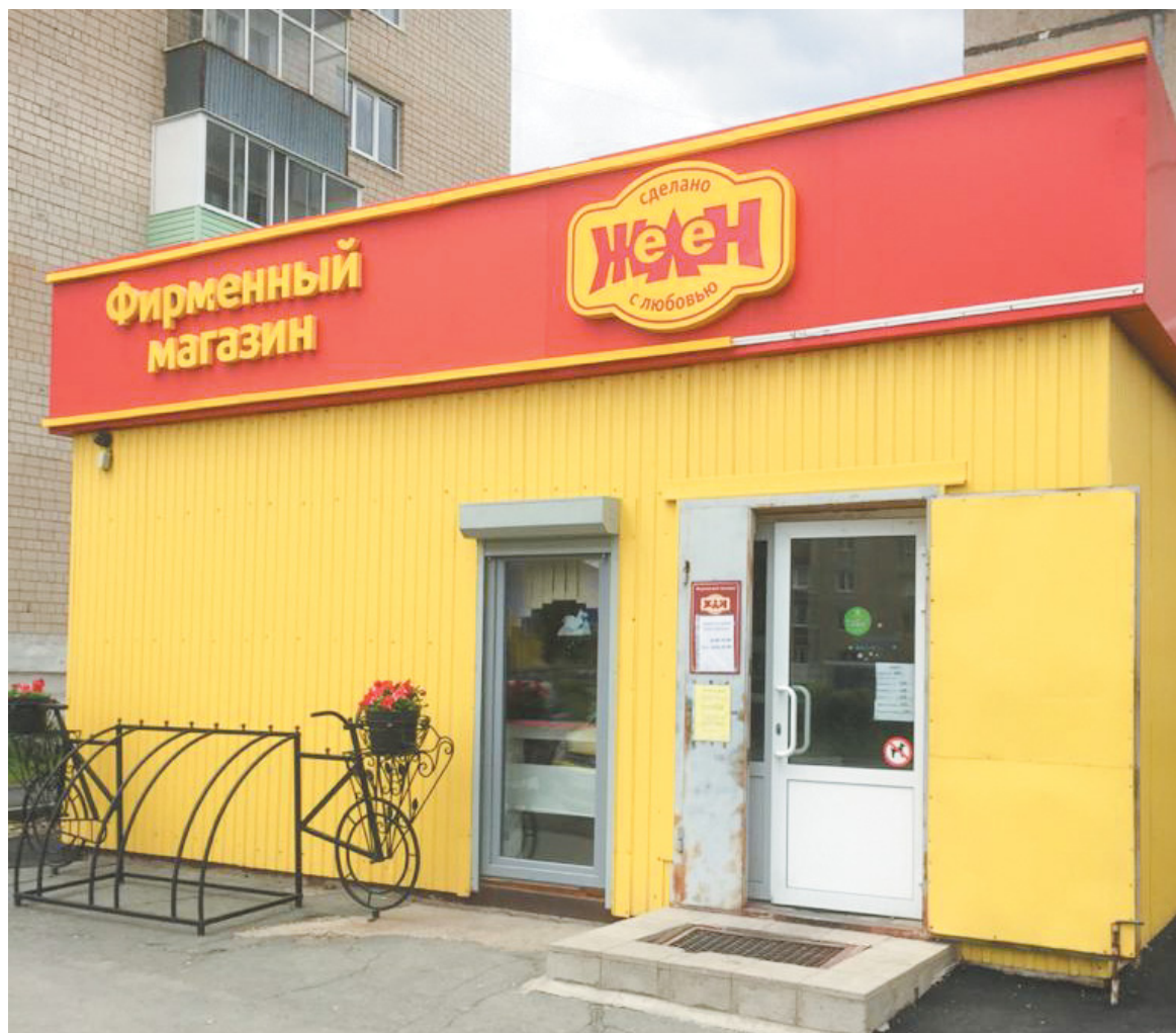
Продукцию «ЖеЛеН» можно приобрести в фирменных магазинах

Самая первая награда предприятия за «Докторскую» колбасу получена в том же 2009 году. Тогда на крупнейшей в России и Европе XI Российской агропромышленной выставке «Золотая осень» предприятие «ЖеЛеН» было удостоено диплома мэра Москвы и бронзовой медали. А в 2011-м оно вошло в тройку лидеров областного смотра-конкурса качества колбасных изделий в номинации «Классическая «Докторская»». Уже на следующий год мясокомбинат стал победителем еще одного областного престижного конкурса – «Наша марка». А на XI Российской агропромышленной выставке «Золотая осень» за колбасу вареную