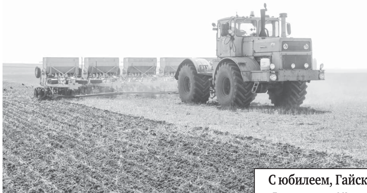
Посевная на полях ИП Кобелев С.Н.