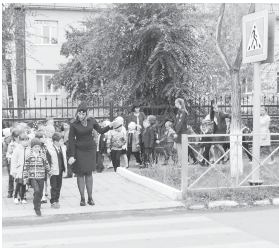
Объясняем малышам, как правильно переходить через дорогу

- школа – дом», которые также должны быть вклеены в дневники учеников начальных классов. Ежегодно эти приказы и схемы обновляются. Также с младшими школьниками должны проводиться ежедневные «пятиминутки безопасности». Контролируем наличие протоколов инструктажа родителей о соблюдении правил дорожного движения перед началом каникул. И это, конечно же, не все.