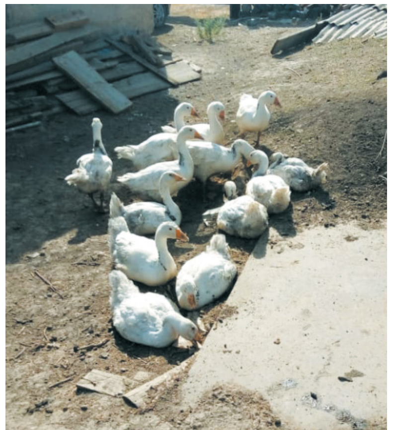
На подворье Кулябовых