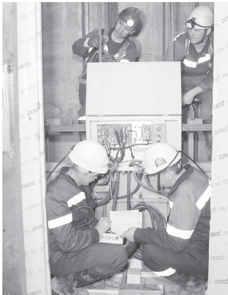
В ходе пуско-наладочных работ в марте произведена комплексная настройка лифта

Сегодня новый шахтный лифт работает в пуско-наладочном режиме. Ведется отладка всех систем подъемника для запуска.