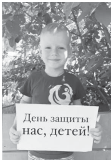
Фрагмент ролика к Дню защиты детей (село Новочеркасское)

были разработаны специалистами регионального центра развития культуры Оренбургской области на платформе Zoom, записи также представлены в социальной сети ВКонтакте и доступны для просмотра в любое время. Можно изучить вебинары специалистов из других регионов.