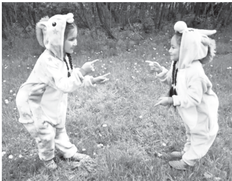
Участницы народного ансамбля танца «Катюша»

другой – большое количество просмотров роликов в социальных сетях Одноклассники и ВКонтакте, на нашем канале в Ютубе. Значит те, кто может загрузить - показывают остальным. Получается, людям интересно. Огромный плюс виртуальных концертов в том, что у участников самодеятельности есть возможность показать свои выступления родным и близким за пределами области и даже страны, сейчас общение и обмен позитивным настроением – это главное.