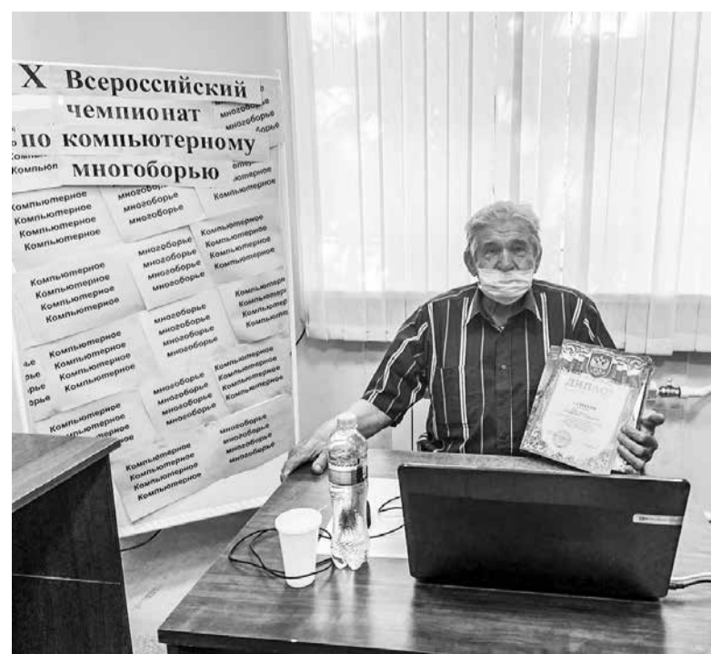
Территориальный этап X Всероссийского чемпионата по компьютерному многоборью среди граждан пожилого возраста в городе Гае