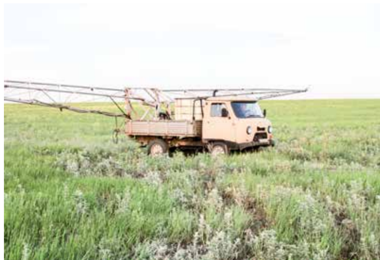
Химпрополка в разгаре

– Давно работаю здесь, четвертый или пятый год. Жил в Гае, в 2019-м переехал в Оренбург, на сезон вернулся сюда. Зимой работаю на себя, грузоперевозками занимаюсь. Полевые работы отличаются от городских заработком, в первую очередь. Если здесь ты трудиться весь сезон, то и оплата будет хорошая, в городе же зарабатываешь меньше, но круглый год. Ну и, конечно, это свежий воздух, природа. В посевную и уборку работаю на КамАЗе, занимаюсь перевозкой зерна. Если сравнить посевную кампанию прошлого года и 2020-го, в этот раз прошла она лучше. Техника меньше ломалась, редко что выходило из строя, погода помогала – дождей не было совсем. Если до этого могли работы остановиться на 3-4 дня и больше, этой весной тормозили на сутки всего или даже меньше.