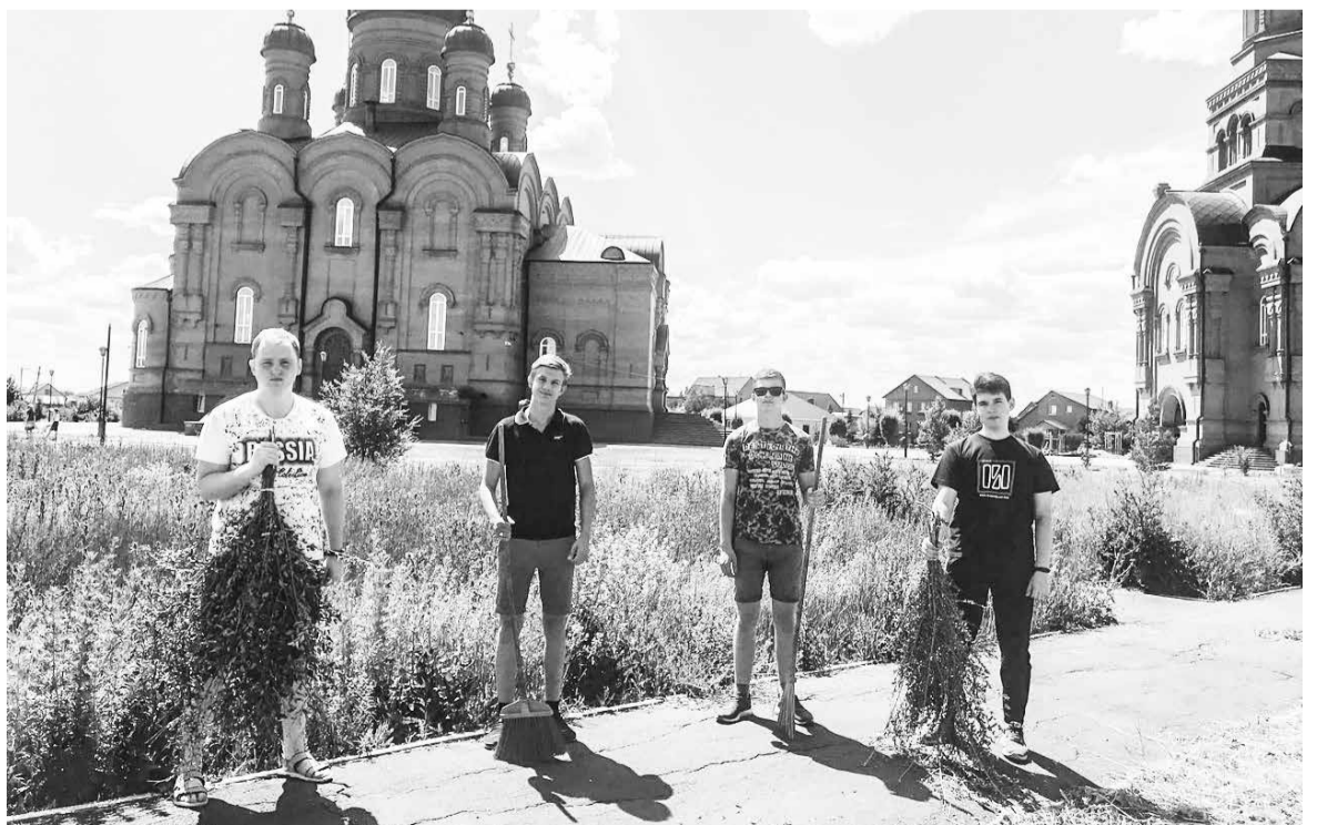
Представители молодежного отдела Гайского благочиния Орской епархии на уборке территории кафедрального собора святого праведного Иоанна Кронштадтского