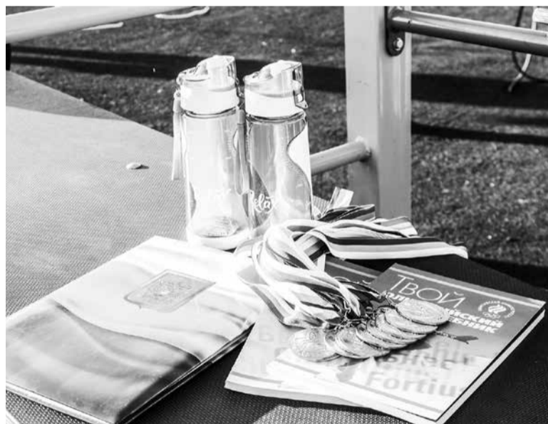
И это только начало

- Сильно. Многие мероприятия пришлось отменить, тренировки массовые притормозить, и даже одиночные на свежем воздухе первое время же были запрещены. Но все с пониманием отнеслись к сложившейся ситуации, люди занимались дома и готовились к сдаче норм ГТО. Спортивная жизнь не остановилась, а просто немного притормозила свои темпы.