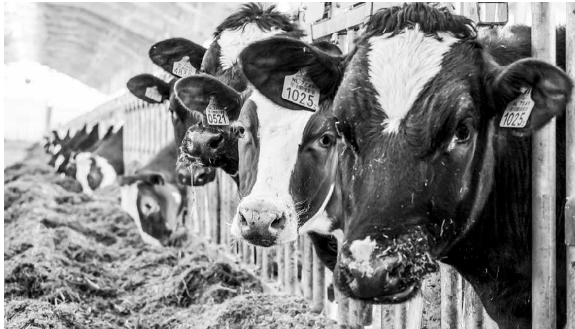
В нынешнем году более двух тысяч оренбургских многодетных семей, проживающих в сельской местности, получат средства на развитие подсобных хозяйств