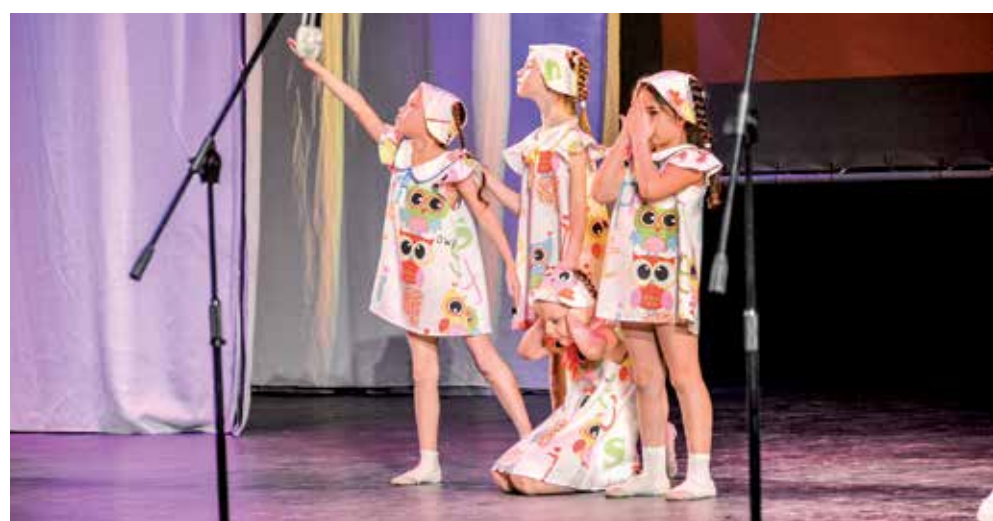
Народный ансамбль танца «Катюша»