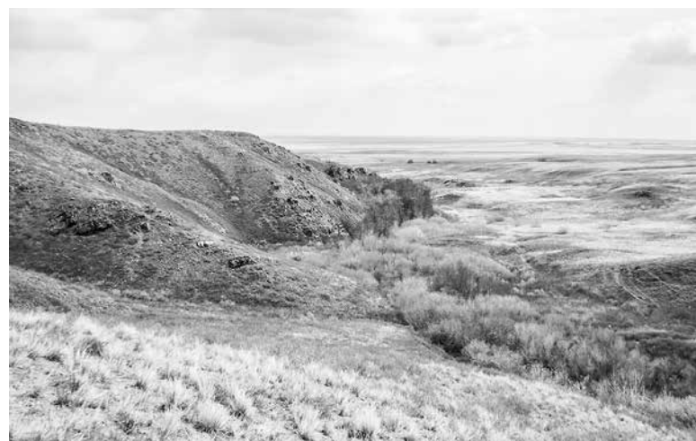
Наши степные маршруты