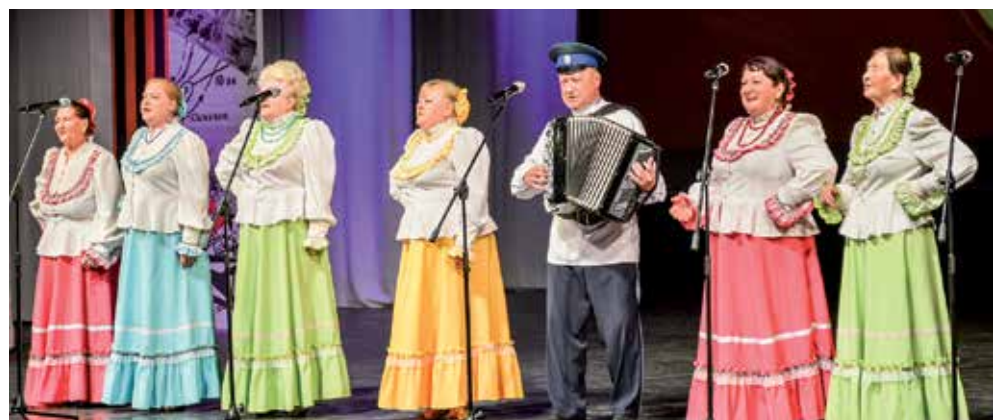
Народный ансамбль казачьей песни «Уралочка»