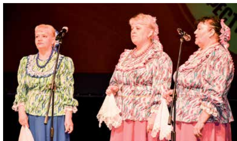
Народный ансамбль казачьей песни «Селяночка»