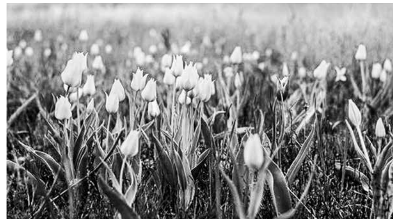
Цветут тюльпаны Шренка