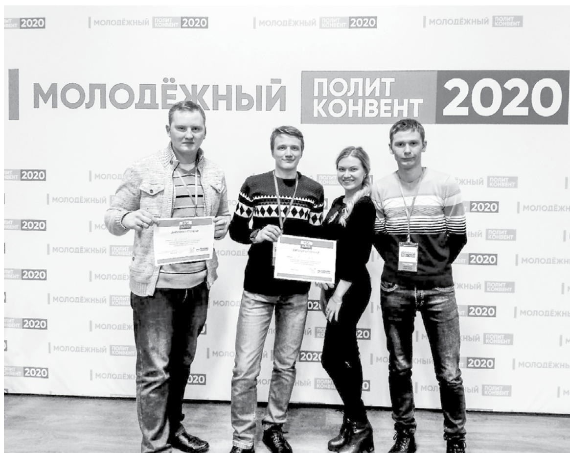
Представители Гайского городского округа

- Самым интересным было выступление Дениса Долженко - председателя комитета по экономической политике и собственности Законодательного Собрания Вологодской области.