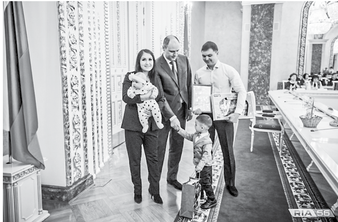
Губернатор Денис Паслер вручил сертификаты на улучшение жилищных условий