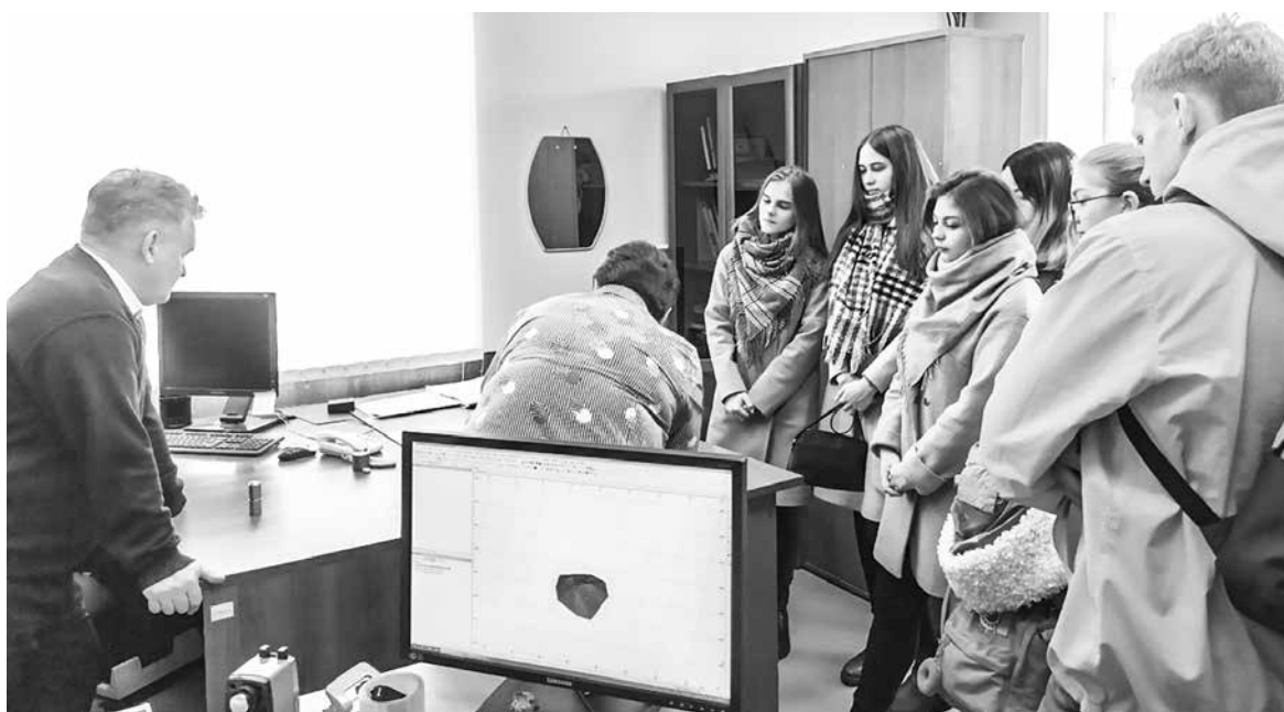
Маркшейдер – работа тонкая

А те старшеклассники, которым ближе информационные технологии, побывали в учебном центре Гайского горно-обогатительного комбината.