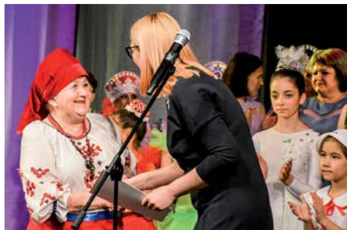
Награждение участников фестиваля