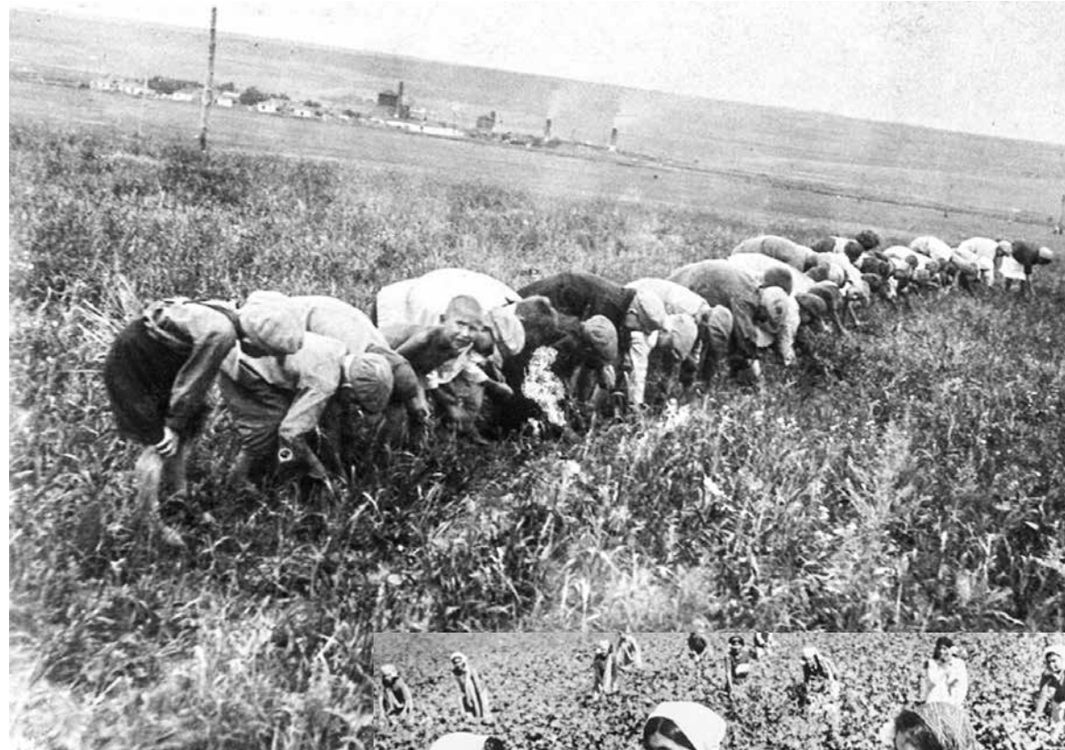
Детям предстояло вручную подобрать потерявшиеся колоски и доставить к месту обмолота