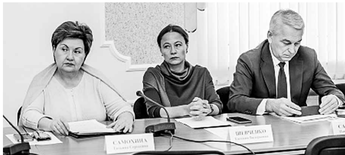
Очередное заседание организационного комитета по подготовке к празднованию 75-летия Великой Победы