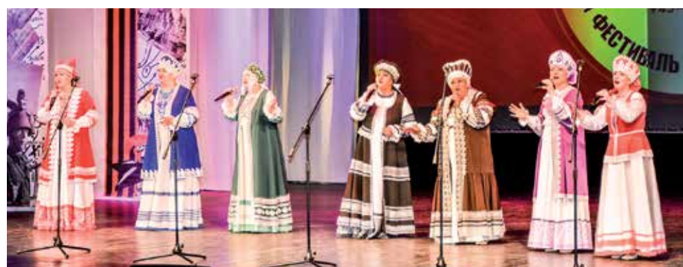
Ансамбль русской песни «Любава»