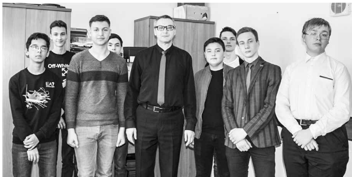
Будущие программисты осваивают азы