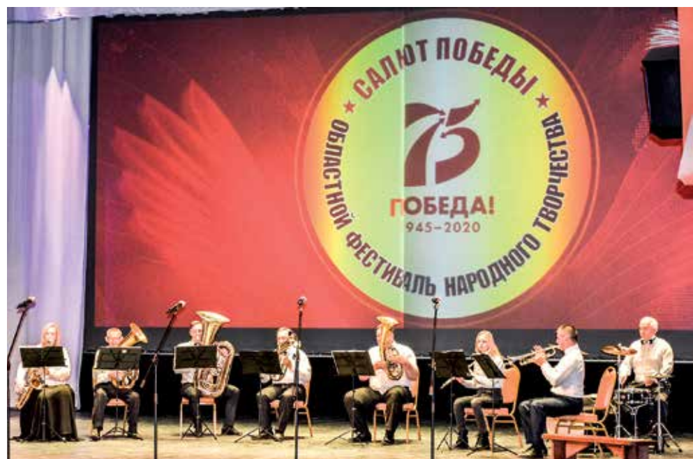
Открывающий программу духовой оркестр «Маэстро»