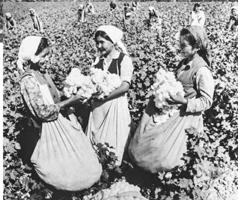
Так собирали хлопок на полях Узбекистана

Хотя, если пораскинуть мозгами, чем мы хуже взрослых? Я вон даже на одноконной косилке пробовал житняк на сено косить. Правда, оплошал малость. То ли ростом не вышел, то ли с лошадей общего языка не нашел. Толковые кони все на фронте, а эти, выбракованные, с нами знаться не хотят. За взрослыми нам, конечно, не угнаться, но мы старались. Нам, детям, за участие в сельхозработах тоже начислялись трудодни. Прошлой осенью мать несла домой полмешка проса, заработан-