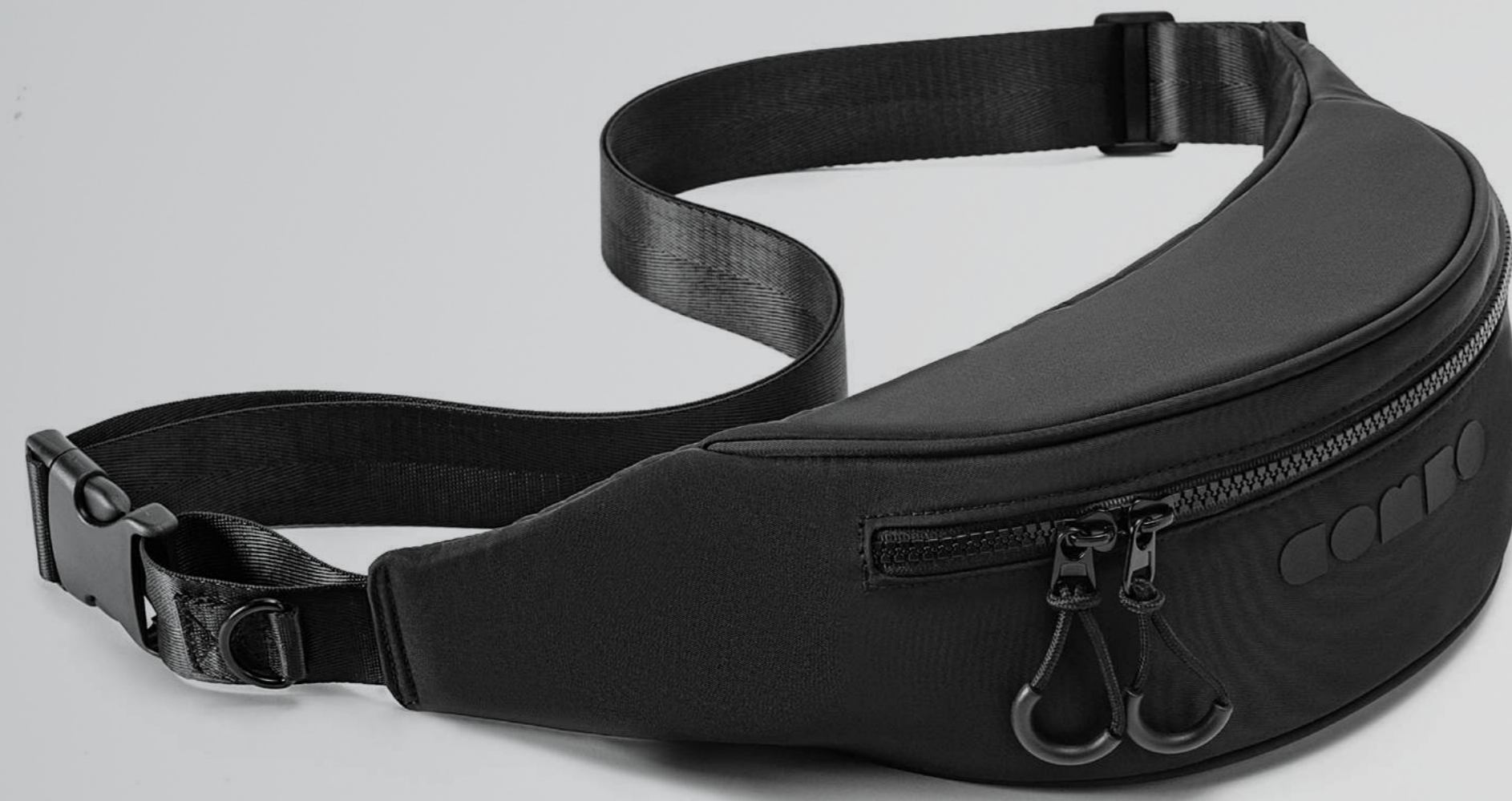
ПОЯСНАЯ СУМКА COMBO