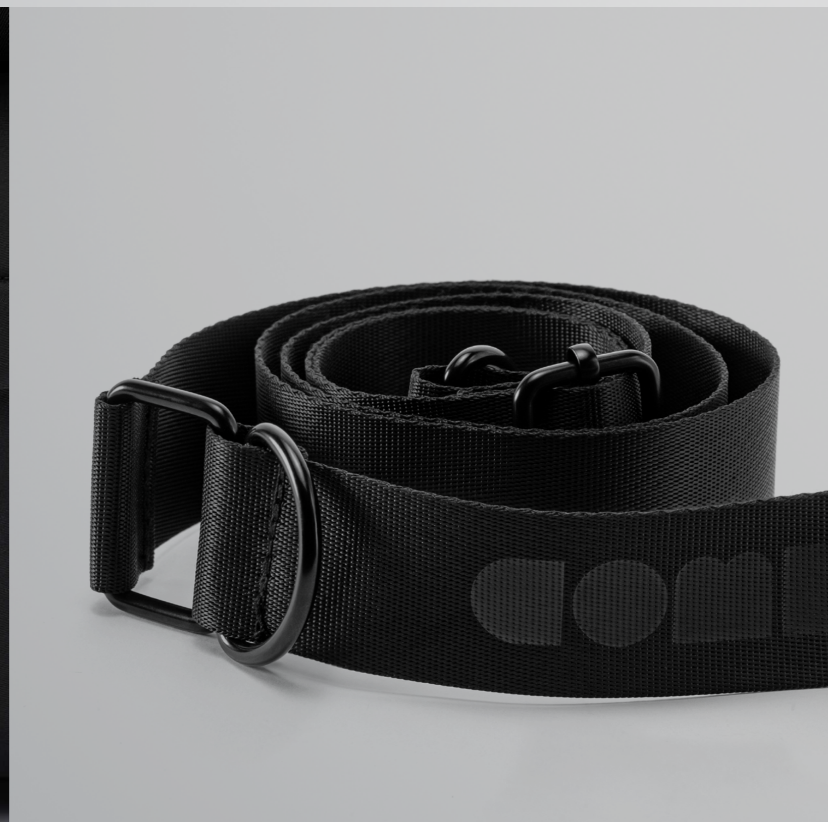
Тиснение на стропе