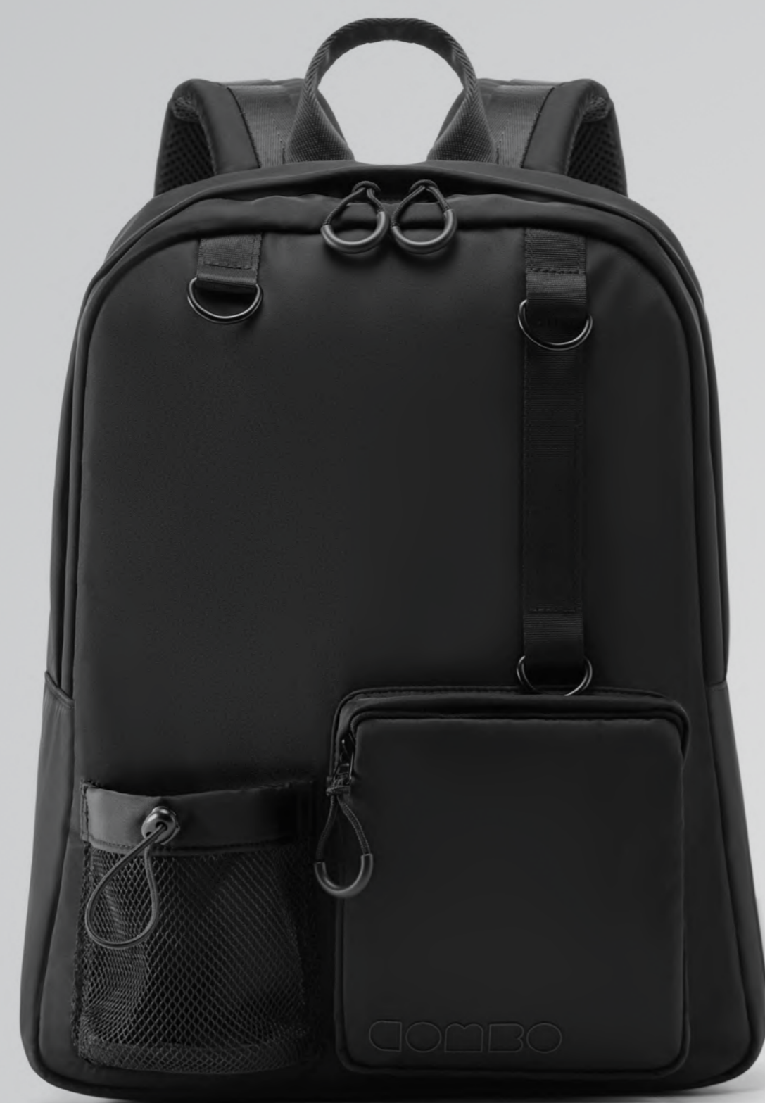
РЮКЗАК COMBO MINI

Размер: 30 x 40 x 15 см Материал: Re-Nylon