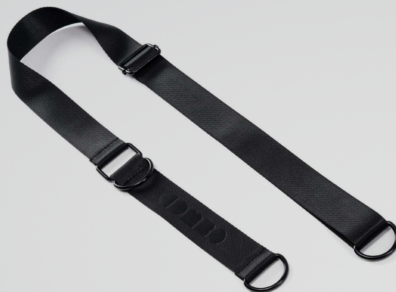
СТРОПА ДЛЯ НАВЕСНЫХ КАРМАНОВ