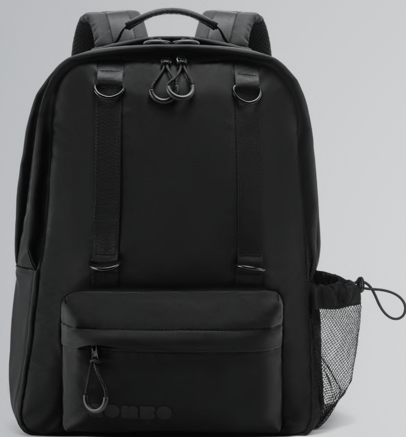
РЮКЗАК COMBO MAXI