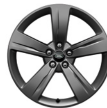
19-дюймовый легкосплавный колёсный диск с 5 спицами и отделкой Satin Dark Grey, Style 5046