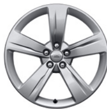
19-дюймовый легкосплавный колёсный диск с 5 спицами, Style 5046