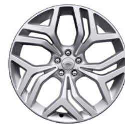
21-дюймовый легкосплавный колёсный диск с 5 сдвоенными спицами, Style 5047