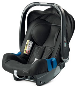
Детское автомобильное кресло, группа 0+ (от рождения до 13 кг)

Предназначено для детей весом до 13 кг (в возрасте от рождения до примерно 12–15 месяцев). С логотипом Land Rover. Устанавливается на заднем сиденье обязательно против хода движения автомобиля. Дополнено ветро- и солнцезащитным козырьком и чехлом с мягкой подкладкой, который допускает машинную стирку. Положение подголовника и пятиточечных удерживающих ребёнка ремней легко регулируется. Надёжно фиксируется в автомобиле с помощью трёхточечного ремня безопасности или базового крепления ISOFIX. Соответствует европейским стандартам ECE R44-04.