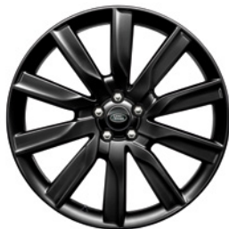
21-дюймовый легкосплавный колёсный диск с 10 спицами и отделкой Gloss Black, Style 1033