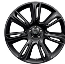
22-дюймовый легкосплавный колёсный диск с 7 сдвоенными спицами и отделкой Gloss Black, Style 7015