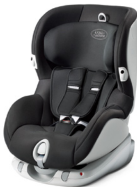
Детское автомобильное кресло, группа 1 (9–18 кг)

Предназначено для детей весом до 13 кг (в возрасте от рождения до примерно 12–15 месяцев). С логотипом Land Rover. Устанавливается на заднем сиденье обязательно против хода движения автомобиля. Дополнено ветро- и солнцезащитным козырьком и чехлом с мягкой подкладкой, который допускает машинную стирку. Положение подголовника и пятиточечных удерживающих ребёнка ремней легко регулируется. Надёжно фиксируется в автомобиле с помощью трёхточечного ремня безопасности или базового крепления ISOFIX. Соответствует европейским стандартам ECE R44-04.