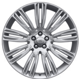
22-дюймовый легкосплавный колёсный диск с 9 сдвоенными спицами, Style 9007