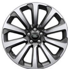
20-дюймовый легкосплавный колёсный диск с 10 спицами и отделкой Diamond Turned, Style 1032