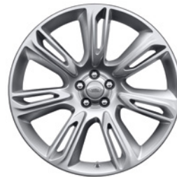
22-дюймовый легкосплавный колёсный диск с 7 сдвоенными спицами, Style 7015