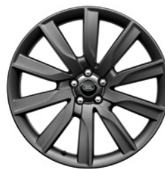
21-дюймовый легкосплавный колёсный диск с 10 спицами и отделкой Satin Dark Grey, Style 1033