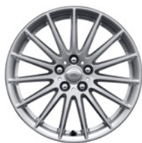
18-дюймовый легкосплавный колёсный диск с 15 спицами, Style 1022