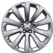
20-дюймовый легкосплавный колёсный диск с 10 спицами, Style 1032