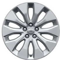
18-дюймовый легкосплавный колёсный диск с 10 спицами, Style 1021

Подчеркните индивидуальность Вашего автомобиля с помощью легкосплавных дисков с современным и динамичным дизайном.