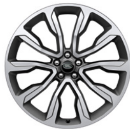
22-дюймовый легкосплавный колёсный диск с 10 спицами и отделкой Satin Technical Grey, Style 1051 Diamond Turned