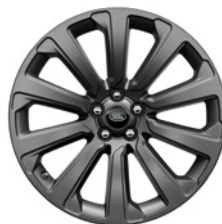
20-дюймовый легкосплавный колёсный диск с 10 спицами и отделкой Satin Dark Grey, Style 1032