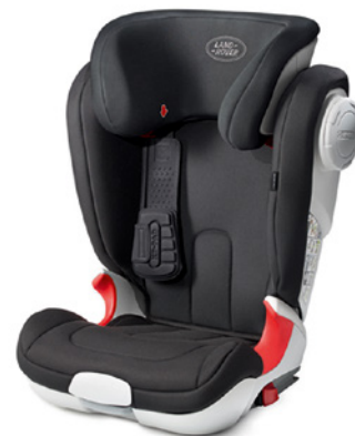
Детское автомобильное кресло, группа 2–3 (15–36 кг)

Предназначено для детей весом 9–18 кг (в возрасте примерно от 15 месяцев до 4 лет). С логотипом Land Rover. Кресло устанавливается по ходу движения на заднем сиденье. Чехол с мягкой подкладкой допускает машинную стирку. Пятиточечные ремни и подголовник регулируются. Улучшенная защита от бокового удара. Несколько позиций наклона спинки. Только для использования с системой крепления ISOFIX. Дополнено индикатором, отражающим корректность фиксации крепления ISOFIX, и кнопкой, позволяющей легко отстегнуть кресло. Соответствует европейским стандартам ECE R129/01.