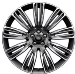
22-дюймовый легкосплавный колёсный диск с 9 сдвоенными спицами и отделкой Diamond Turned, Style 9007