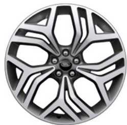
21-дюймовый легкосплавный колёсный диск с 5 сдвоенными спицами и отделкой Diamond Turned, Style 5047