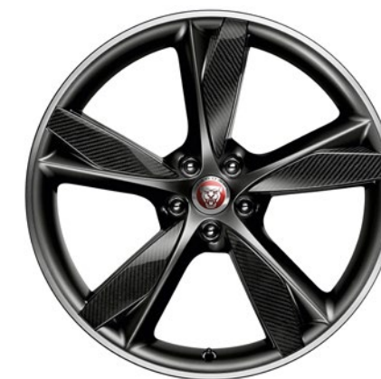
20-дюймовый легкосплавный диск с 5 спицами и отделкой Carbon Fibre/Satin Dark Grey Diamond Turned, Style 5042