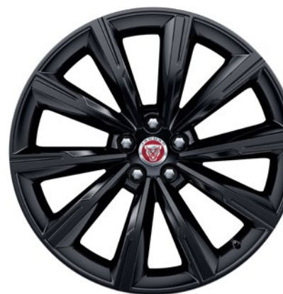
20-дюймовый легкосплавный диск с 10 спицами и отделкой Gloss Black, Style 1066