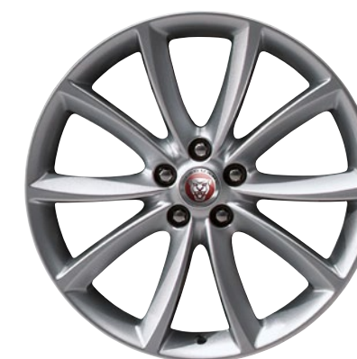
19-дюймовый легкосплавный диск с 10 спицами, Style 1023