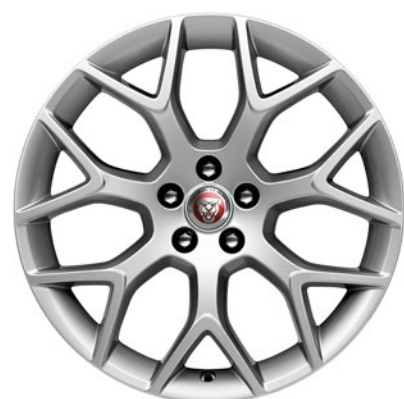
19-дюймовый легкосплавный диск с 7 сдвоенными спицами, Style 7013