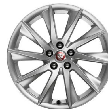
18-дюймовый легкосплавный диск с 10 спицами, Style 1024