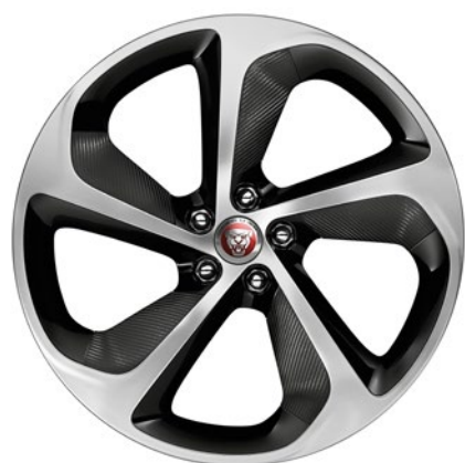
20-дюймовый легкосплавный диск с 5 спицами, Style 5062