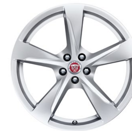
20-дюймовый легкосплавный диск с 5 спицами, Style 5060