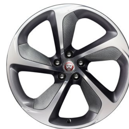
20-дюймовый легкосплавный диск с 5 спицами и отделкой Carbon Fibre Silver Weave, Style 5062