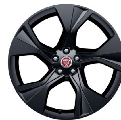
20-дюймовый легкосплавный диск с 5 спицами и отделкой Gloss Black, Style 5102