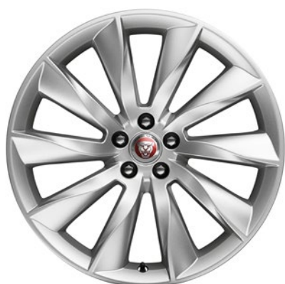
20-дюймовый легкосплавный диск с 10 спицами, Style 1025