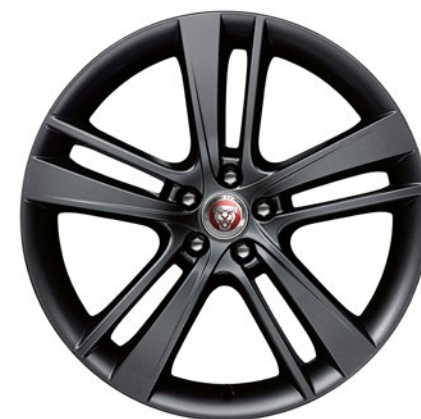
20-дюймовый легкосплавный диск с 5 сдвоенными спицами и отделкой Gloss Black, Style 5041