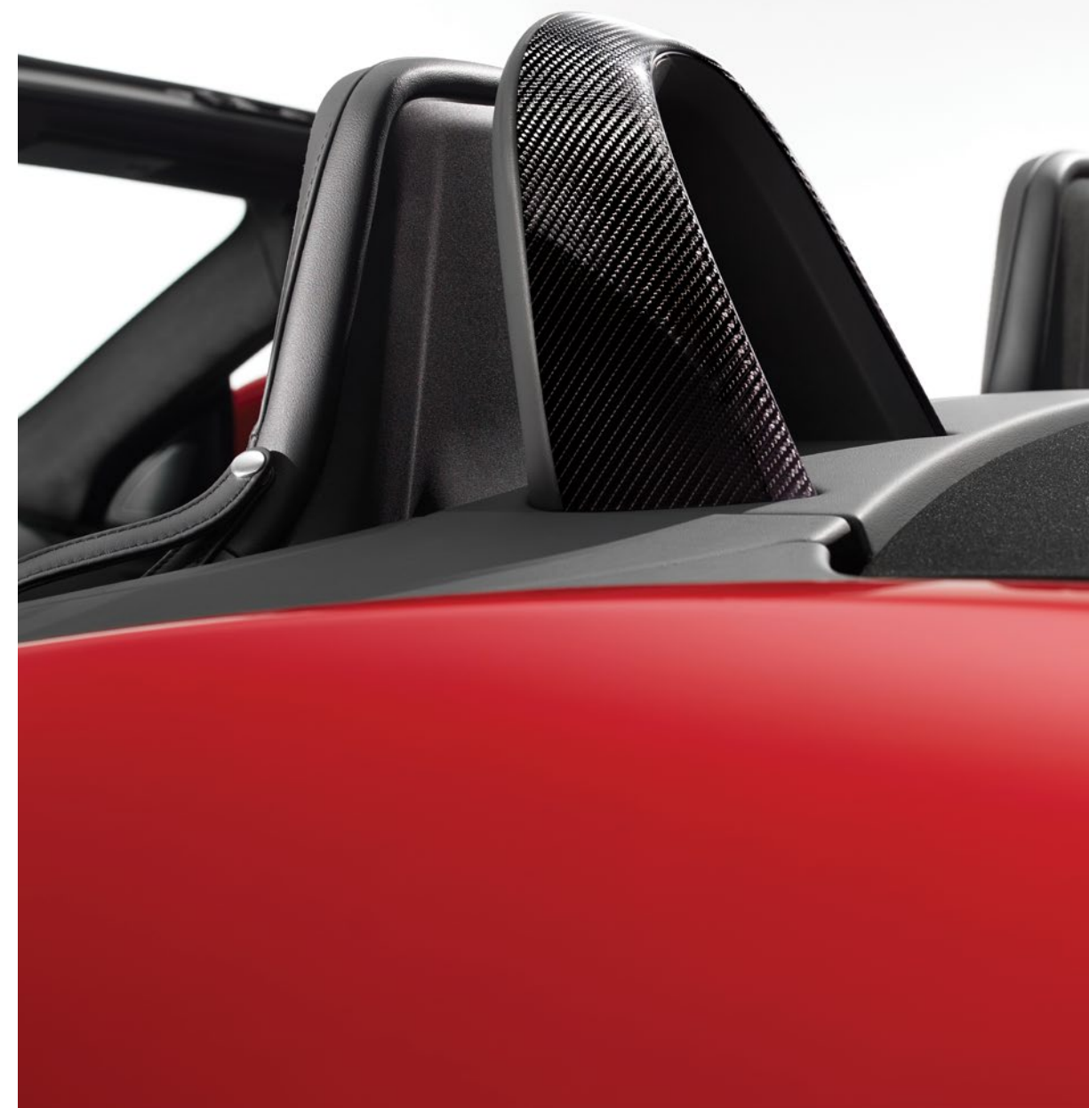
Карбоновые дуги системы защиты при опрокидывании — Silver Weave