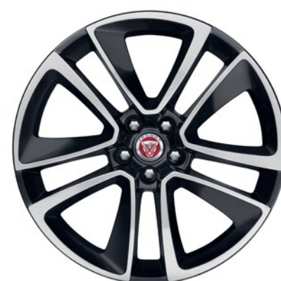
19-дюймовый легкосплавный диск с 5 сдвоенными спицами и отделкой Technical Grey Diamond Turned, Style 5058