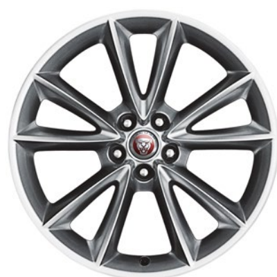
19-дюймовый легкосплавный диск с 5 сдвоенными спицами, Style 5057