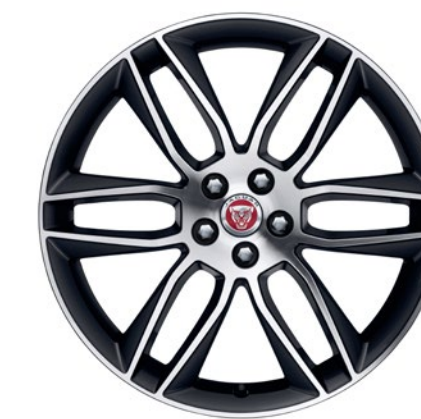
20-дюймовый легкосплавный диск с 6 сдвоенными спицами и отделкой Dark Grey Diamond Turned, Style 6003