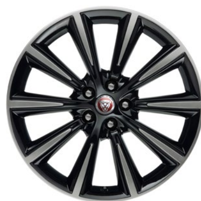
19-дюймовый легкосплавный диск с 10 спицами и отделкой Gloss Black Diamond Turned, Style 1026