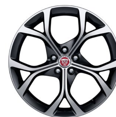
19-дюймовый легкосплавный диск с 5 сдвоенными спицами и отделкой Gloss Black Diamond Turned, Style 5101