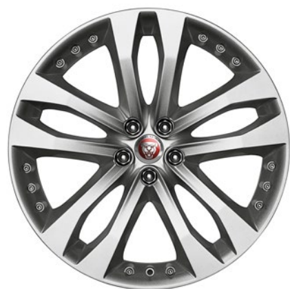
20-дюймовый легкосплавный диск с 5 сдвоенными спицами, Style 5039