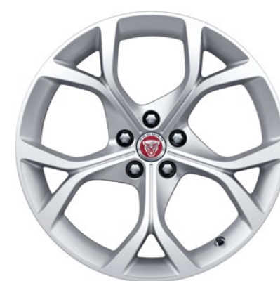
19-дюймовый легкосплавный диск с 5 сдвоенными спицами и отделкой Silver, Style 5101