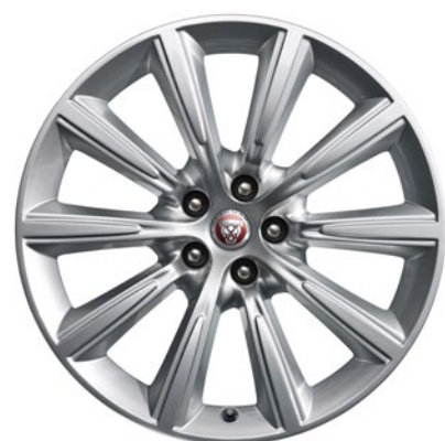
19-дюймовый легкосплавный диск с 10 спицами, Style 1026