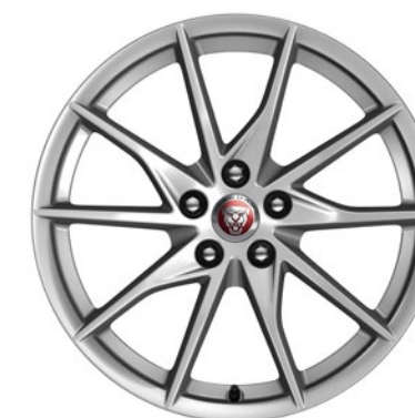
18-дюймовый легкосплавный диск с 10 спицами, Style 1036