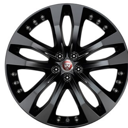
20-дюймовый легкосплавный диск с 5 сдвоенными спицами и отделкой Gloss Black, Style 5039