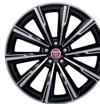
20-дюймовый легкосплавный диск с 10 спицами и отделкой Gloss Black Diamond Turned, Style 1066