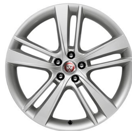
20-дюймовый легкосплавный диск с 5 сдвоенными спицами, Style 5041