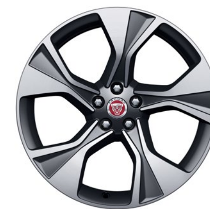
20-дюймовый легкосплавный диск с 5 спицами и отделкой Technical Grey Diamond Turned, Style 5102