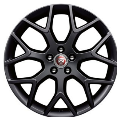
19-дюймовый легкосплавный диск с 7 сдвоенными спицами и отделкой Gloss Black, Style 7013