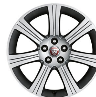
18-дюймовый легкосплавный диск с 7 спицами, Style 7017