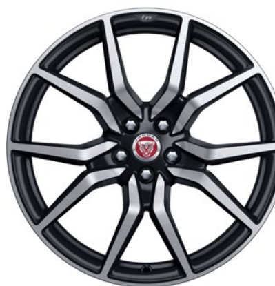
20-дюймовый легкосплавный диск с 10 спицами и отделкой Satin Black Diamond Turned, Style 1041