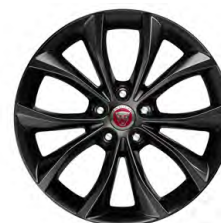
18-дюймовый легкосплавный диск с 10 спицами и отделкой Gloss Black, Style 5033