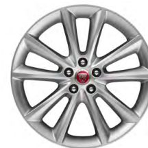
19-дюймовый легкосплавный диск с 10 спицами, Style 1018