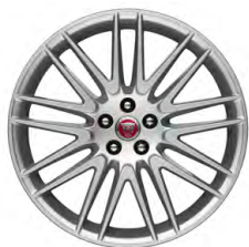
20-дюймовый легкосплавный диск с 9 сдвоенными спицами, Style 9004