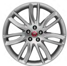
19-дюймовый легкосплавный диск с 7 сдвоенными спицами, Style 7012