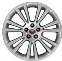
19-дюймовый легкосплавный диск с 7 сдвоенными спицами, Style 7013