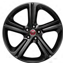
19-дюймовый легкосплавный диск с 5 спицами и отделкой Gloss Black, Style 5035