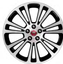
19-дюймовый легкосплавный диск с 7 сдвоенными спицами и контрастной отделкой Diamond Turned, Style 7013