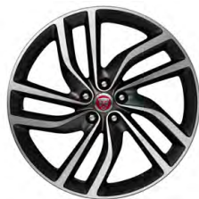
20-дюймовый легкосплавный диск с 5 сдвоенными спицами и отделкой Satin Dark Grey Diamond Turned, Style 5036