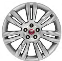
18-дюймовый легкосплавный диск с 7 сдвоенными спицами, Style 7011