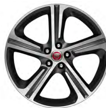
19-дюймовый легкосплавный диск с 5 спицами и отделкой Satin Grey Diamond Turned, Style 5035