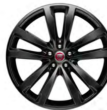
20-дюймовый легкосплавный диск с 5 сдвоенными спицами и отделкой Gloss Black, Style 5031