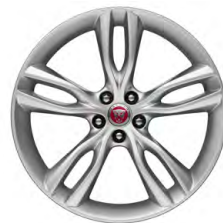
20-дюймовый легкосплавный диск с 5 сдвоенными спицами, Style 5071