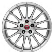
17-дюймовый легкосплавный диск с 10 спицами, Style 1016

Придайте ещё больше индивидуальности Вашему автомобилю с помощью широкого ассортимента легкосплавных колёсных дисков с динамичным современным дизайном.