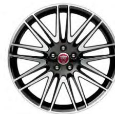
20-дюймовый легкосплавный диск с 9 сдвоенными спицами и контрастной отделкой Diamond Turned, Style 9004