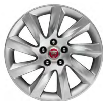
17-дюймовый легкосплавный диск с 9 спицами, Style 9005