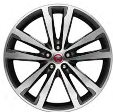
20-дюймовый легкосплавный диск с 5 сдвоенными спицами и отделкой Gloss Dark Grey Diamond Turned, Style 5031