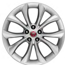
18-дюймовый легкосплавный диск с 10 спицами, Style 5033