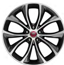
18-дюймовый легкосплавный диск с 10 спицами и контрастной отделкой Diamond Turned, Style 5033