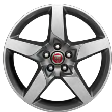
18-дюймовый легкосплавный диск Star с 5 спицами и отделкой Silver