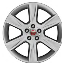
18-дюймовый легкосплавный диск Arm с 6 спицами и отделкой Silver