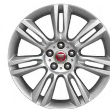
18-дюймовый легкосплавный диск Arm с 7 сдвоенными спицами и отделкой Silver