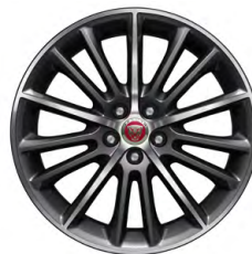
19-дюймовый легкосплавный диск Radiance с 15 спицами и отделкой Black