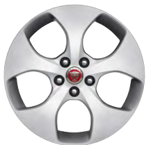
17-дюймовый легкосплавный диск Projector с 5 спицами и отделкой Silver

Придайте ещё больше индивидуальности Вашему автомобилю с помощью широкого ассортимента легкосплавных колёсных дисков с динамичным современным дизайном.