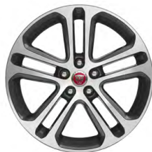
18-дюймовый легкосплавный диск Templar с 5 сдвоенными спицами и отделкой Mid Silver