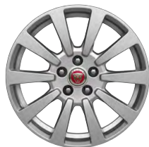
17-дюймовый легкосплавный диск Turbine с 10 спицами и отделкой Silver