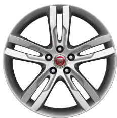
19-дюймовый легкосплавный диск Star с 5 сдвоенными спицами и отделкой Silver