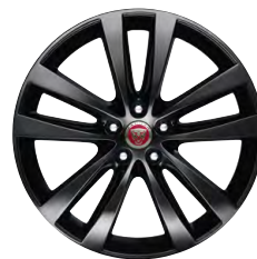
19-дюймовый легкосплавный диск Venom с 5 сдвоенными спицами и отделкой Gloss Black