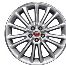
19-дюймовый легкосплавный диск Radiance с 15 спицами и отделкой Silver