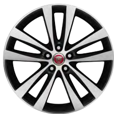
19-дюймовый легкосплавный диск Venom с 5 сдвоенными спицами и отделкой Silver