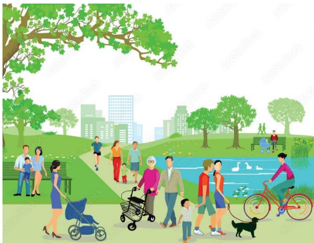
Рис. 4 https://static.vecteezy.com/system/resources/previews/002/091/940/non_2x/amusement-park-scene-at-daytime-with-balloons-in-the-sky-free-vector.jpg