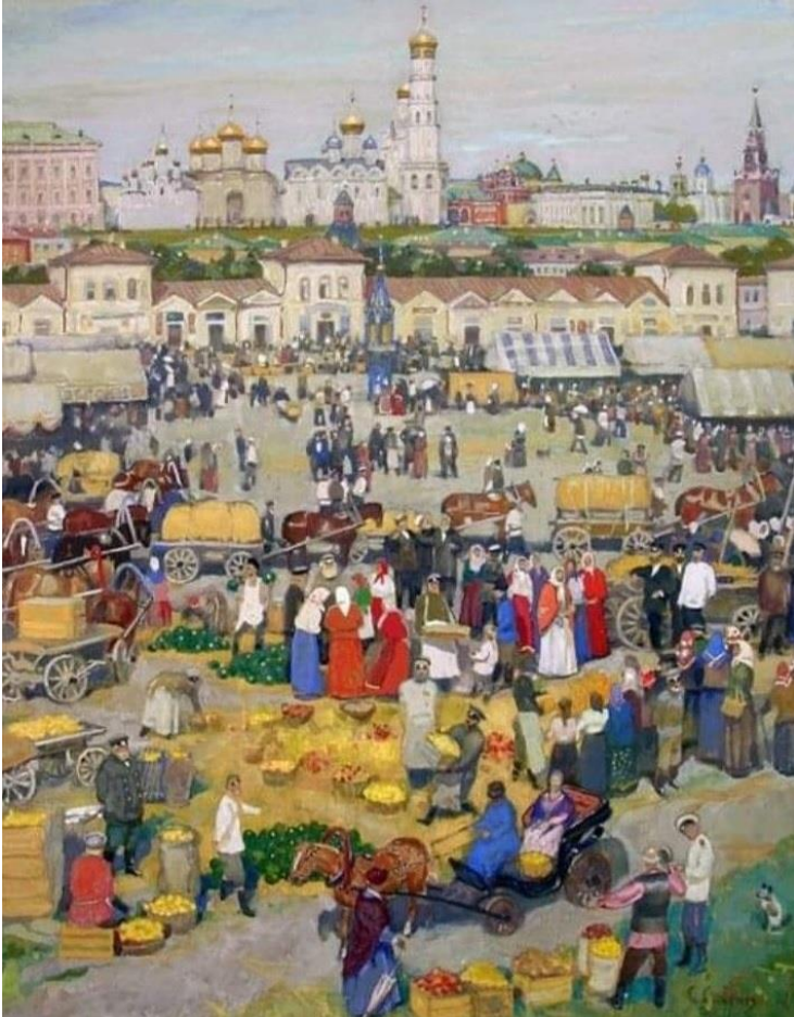
Рис. 1 https://www.timeout.ru/wp-content/uploads/2023/05/5-torg.jpg