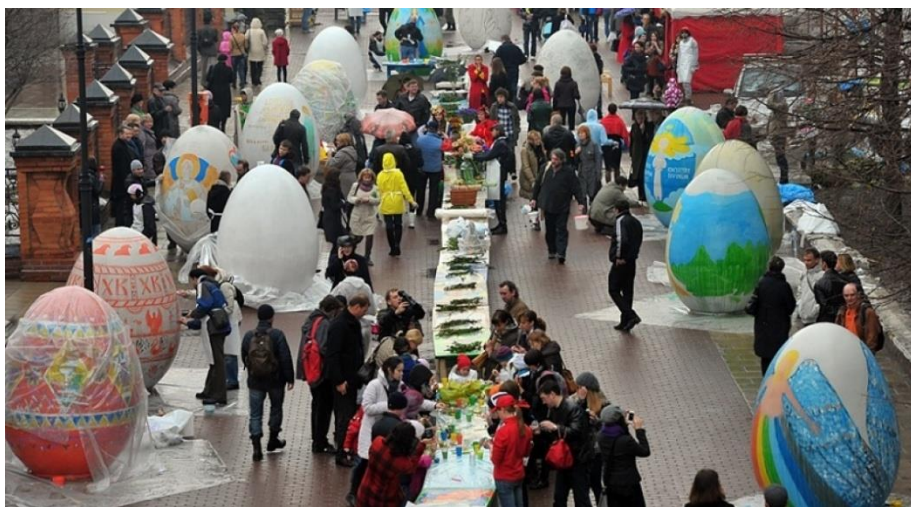
Рис. 2 https://transport.mos.ru/common/upload/img/resize/sc_1063x583_images58_0562a071dd21dafa1dc21fc4050ee278.jpg