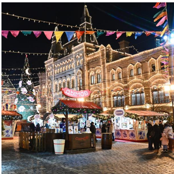
Рис. 4 https://cdn1.gum.ru/upload/iblock/95d/bis_6395.jpg