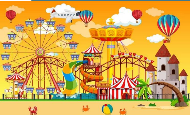
Рис. 3 https://static.vecteezy.com/system/resources/previews/002/091/940/non_2x/amusement-park-scene-at-daytime-with-balloons-in-the-sky-free-vector.jpg