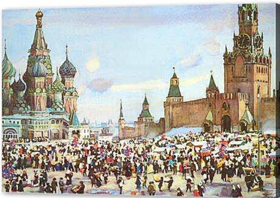
Рис. 2 https://artdecory.ru/pictures/full_61880.jpg&t=1&bst=1