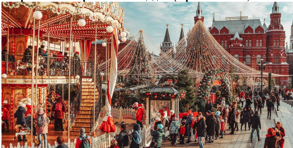
Рис. 1 https://www.mos.ru/upload/newsfeed/newsfeed/GL(154600).jpg