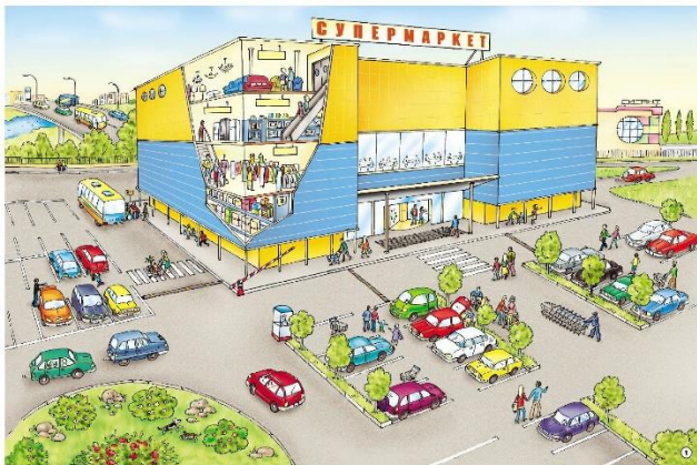
Рис. 2 https://avatars.mds.yandex.net/get-mpic/5194541/img_id7681077419189855109.jpeg/orig