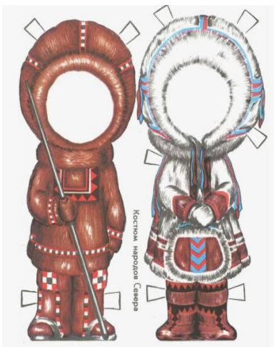
Костюм Народов Севера