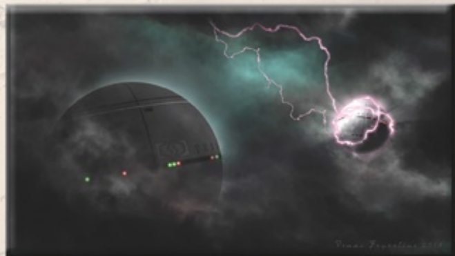
"Всё, что нам нужно, это больше энергии" Бьорн Зигмунд, генеральный директор "ThorGate"

8 кубиков тепла могут быть потрачены для увеличения температуры (и ТР) на 1.