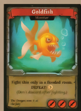
Карта Золотая рыбка