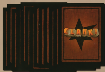
35 карт подземелья