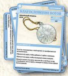
СТОПКА СБРОСА БЛАГОСЛОВЕНИЙ