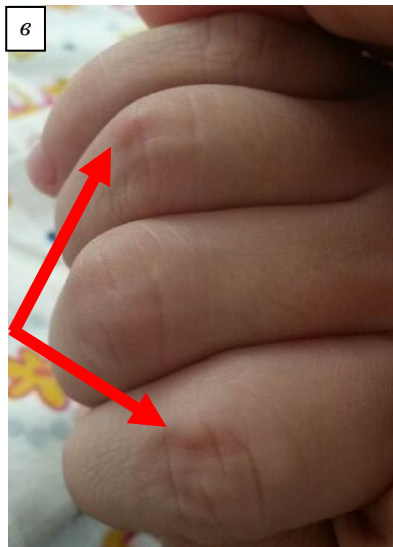
Рис. 3. Кольцевидная эритема (а); ревматические узелки (б, в) (указано стрелками), собственные наблюдения