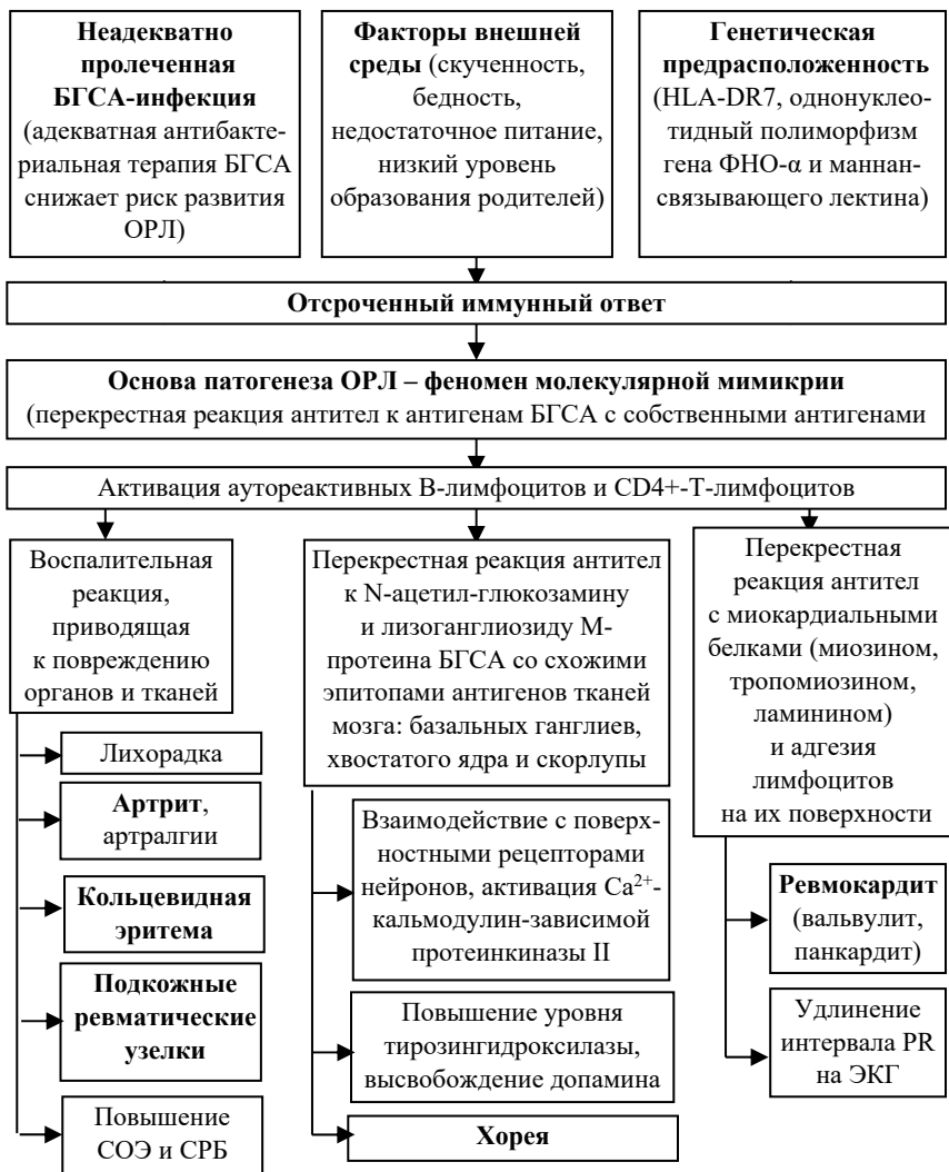
Рис. 1. Патогенез острой ревматической лихорадки:

БГСА – β-гемолитический стрептококк группы А; ОРЛ – острая ревматическая лихорадка; СОЭ – скорость оседания эритроцитов; СРБ – С-реактивный белок; ФНО – фактор некроза опухолей; ЭКГ – электрокардиограмма; CD (cluster of differentiation) – кластер дифференцировки; HLA (human leukocyte antigens) – человеческий лейкоцитарный антиген