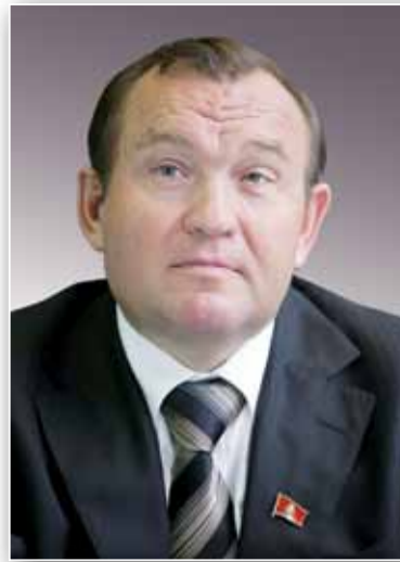
Заместитель мэра г. Москвы в Правительстве г. Москвы