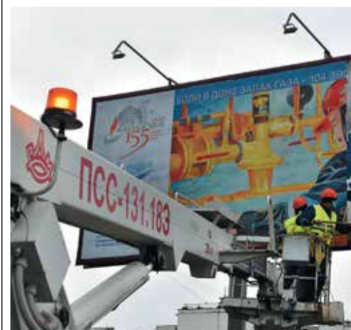
НА УЛИЦАХ МОСКВЫ ПОЯВИ- ЛАСЬ СОЦИАЛЬНАЯ РЕКЛАМА ПО ТЕМЕ ГАЗОВОЙ БЕЗОПАС- НОСТИ