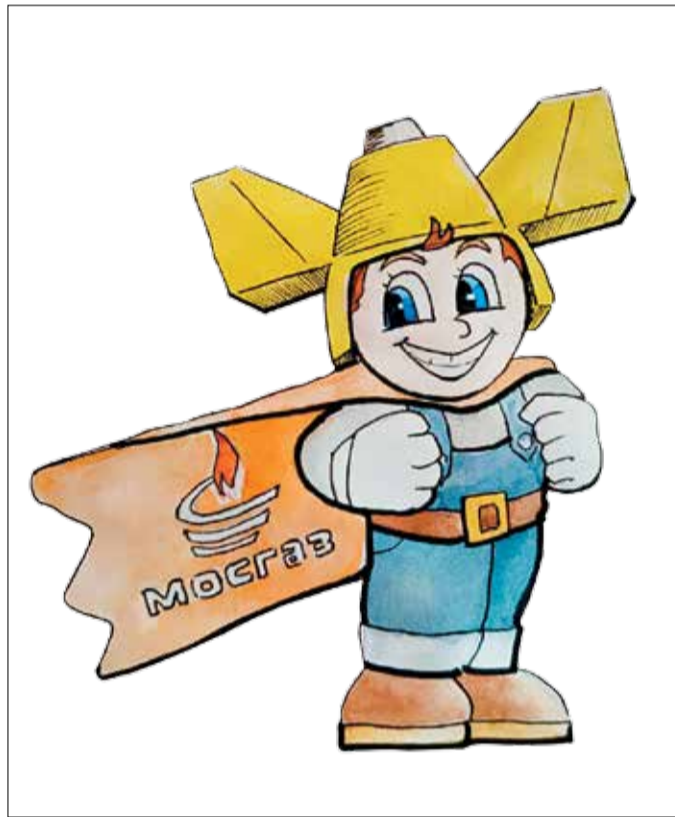
2-е место – «Мосгазик», автор Е.В. Бурыкина (г. Домодедово)