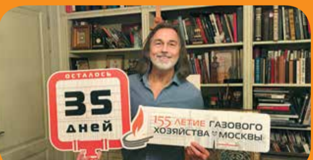
Никас Степанович Сафронов, заслуженный художник РФ, член оргкомитета Московского Международного фестиваля юных талантов «Волшебная сила голубого потока – МОСГАЗ зажигает звезды». Под флагом благотворительности и поддержки подрастающего поколения крепнет дружба Никаса и газового хозяйства Москвы: имя художника придало дополнительный импульс участникам флешмоба семейного творчества «Рисуем с детьми Вечный огонь», а также международного конкурса на создание талисмана АО «МОСГАЗ».