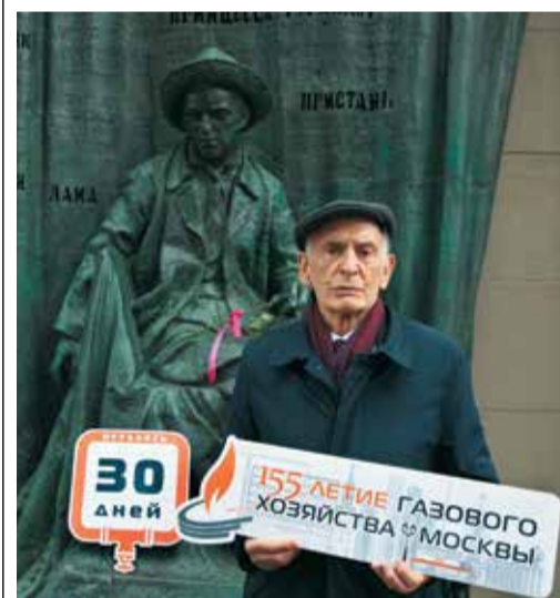
АКЦИЯ «ОБРАТНЫЙ ОТСЧЕТ» Стр. 5