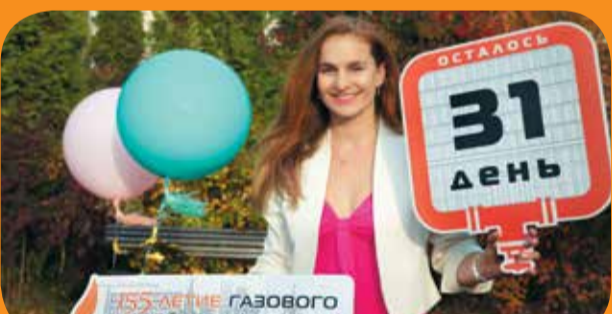
Софья Александровна Великая, российская фехтовальщица на саблях, олимпийская чемпионка в командном первенстве, серебряный призер Олимпийских игр 2012 и 2016 годов в личном первенстве, восьмикратная чемпионка мира и 14-кратная чемпионка Европы, многократная чемпионка России, заслуженный мастер спорта России, капитан Вооруженных Сил Российской Федерации. Спорт в МОСГАЗе стоит в списке ключевых факторов, формирующих и укрепляющих корпоративный дух и целостность коллектива.