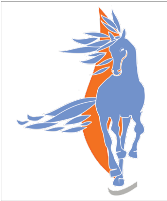
1-е место – «Конь-огонь», автор Е.А. Бруй (г. Москва)

За время проведения мероприятия в Общество приходило множество писем со словами благодарности от участников. Конкурс подарил им возможность провести время с детьми и семьей, раскрыть свой талант широкой аудитории и отвлечься от повседневной жизни хотя бы ненадолго, и это, несомненно, стало прекрасной страницей в истории предприятия.