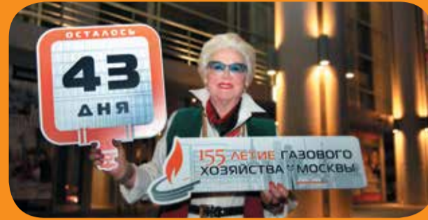
Анна Николаевна Шатилова, народная артистка РСФСР, легендарный диктор и телеведущая, в 2011 году за большие заслуги в развитии отечественного телевидения и многолетнюю плодотворную деятельность отмечена орденом «За заслуги перед Отечеством» III степени. Дружба АО «МОСГАЗ» и Анны Николаевны Шатиловой – особая честь для предприятия, где большое внимание уделяется социальной политике и развитию молодых дарований. Легендарная артистка вошла в состав оргкомитета международного конкурса юных талантов «МОСГАЗ зажигает звезды» и является бессменной ведущей гала-концертов фестиваля.