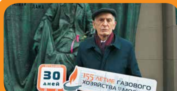
Василий Семенович Лановой, народный артист СССР, Герой Труда Российской Федерации, общественный деятель, театральный педагог, артист Государственного академического театра им. Е. Вахтангова, сопредседатель Центрального штаба ООД «Бессмертный полк России». Большая честь для мосгазовцев – участие Василия Семеновича Ланового в торжественной церемонии профилактики Вечного огня в Александровском саду.