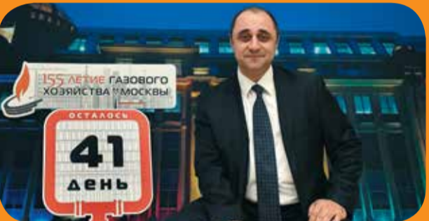
Александр Вячеславович Мачевский, старший вице-президент Государственной корпорации развития «ВЭБ.РФ». МОСГАЗ реализует курс на цифровизацию: на предприятии автоматизировано управленческие производственными и технологическими процессами, активно внедряются новые программные продукты для оперативно-диспетчерского реагирования. Цифровая платформа, разработанная специалистами АО «МОСГАЗ», может быть интересной для регионов России, которые реализуют инвестиционные проекты при поддержке госкорпораций.