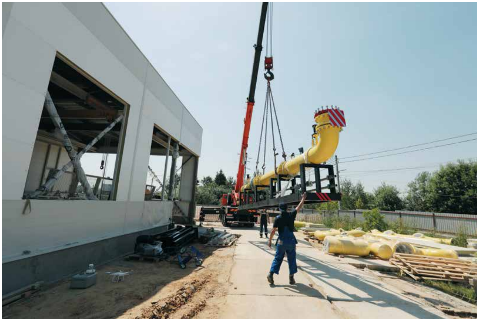
Текущие работы на ГРП «Ликовский»