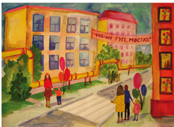
Герасимова Софья. 9 лет. Праздник на улице.