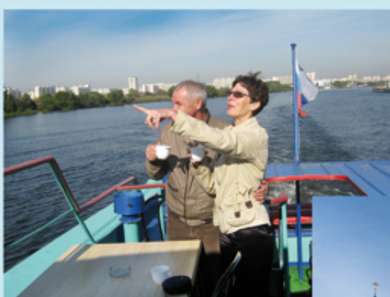
"Экскурсия по Москве - реке в Николо - Угрешский монастырь".

Применять газ для освещения в тех краях научились давно. Но газопроводов тогда ещё не было, и подвести газ в свои дома люди не могли. Зато, по воспоминаниям Афанасия Никитина, обитатели каспийского побережья широко использовали для бытовых нужд вечного спутника природного газа – нефть. Её там было в избытке, и наш путешественник оставил сведения, что из окрестностей, где горели факелы, вывозили нефть для заполнения специальных глиняных светильников.