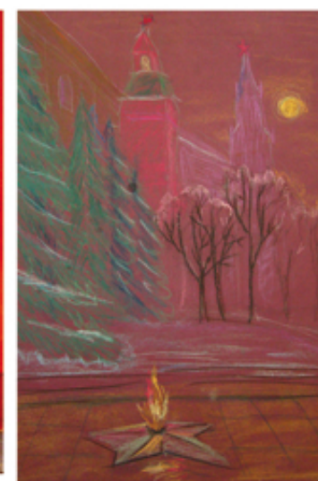
Ткаченко Лера. 7 лет. Вечный огонь памяти.