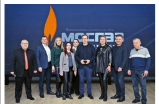
ВИЗИТ АССОЦИАЦИИ «СИБДАЛЬВОСТОКГАЗ»