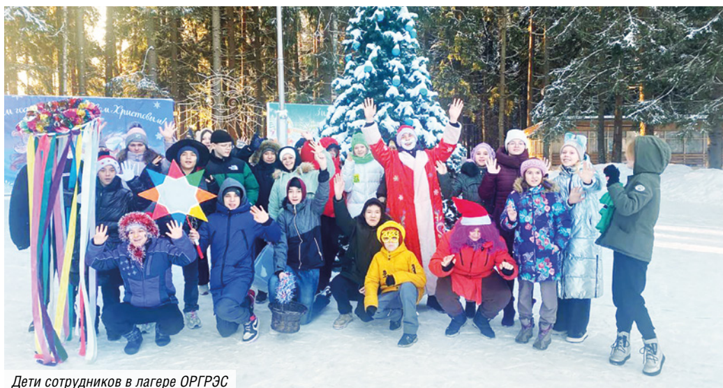
Дети сотрудников в лагере ОРГРЭС