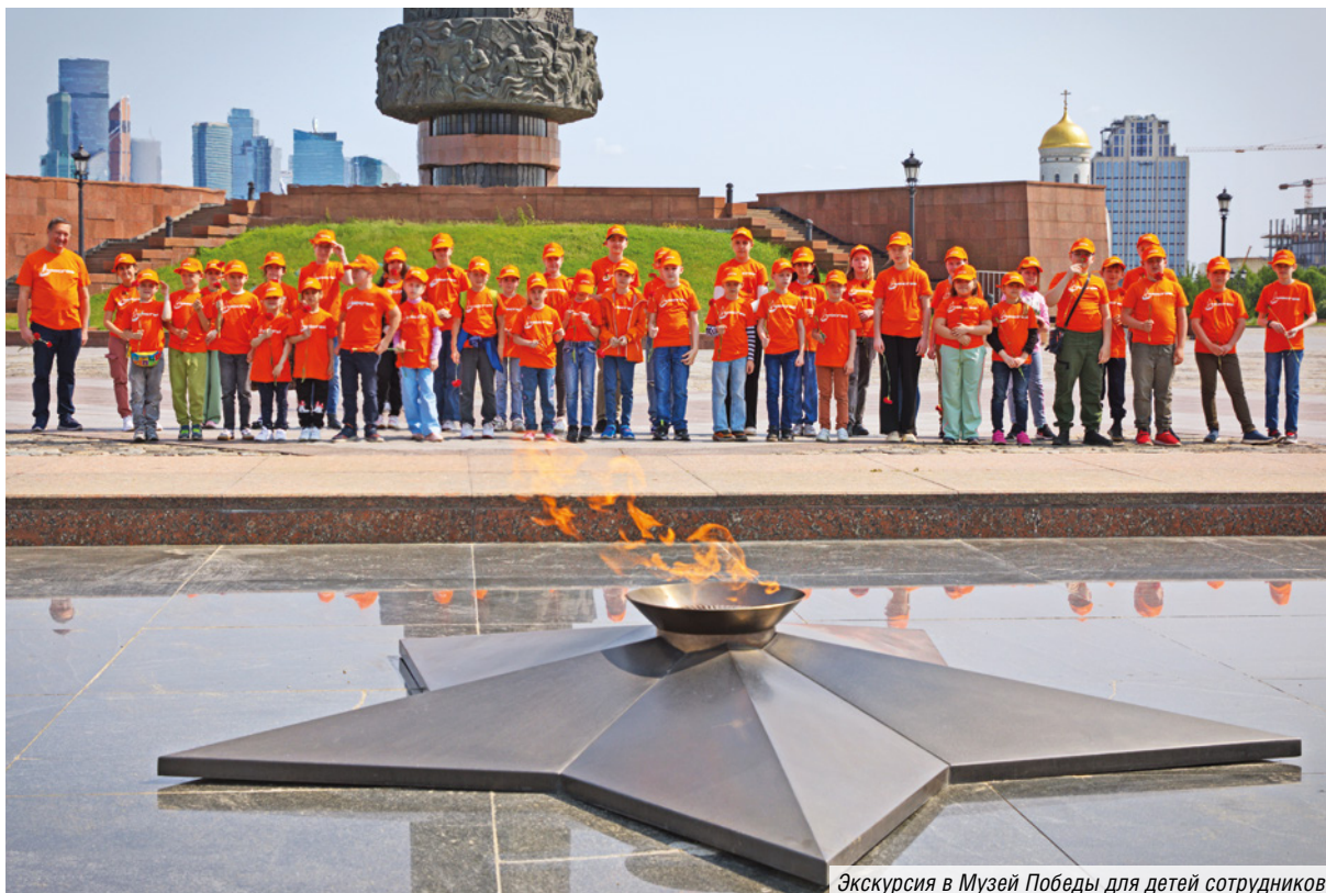
Экскурсия в Музей Победы для детей сотрудников