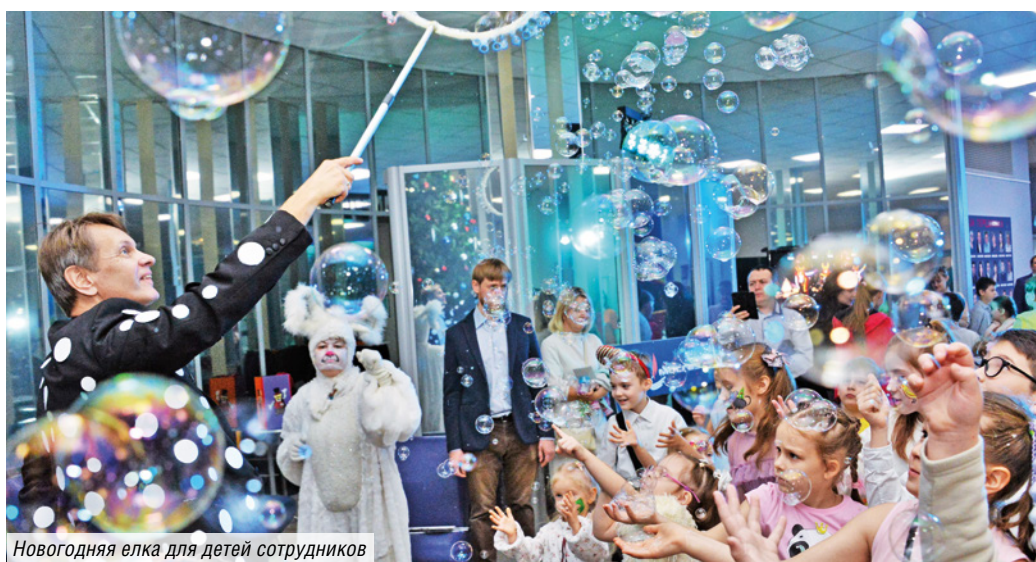
Новогодняя елка для детей сотрудников

МОСГАЗ вместе с Москвой и страной сосредоточится на актуальной национальной повестке, продолжит всемерно поддерживать тех, для кого много детей рядом — безусловное счастье и истинный смысл жизни.