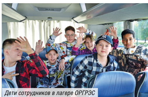
Дети сотрудников в лагере ОРГРЭС