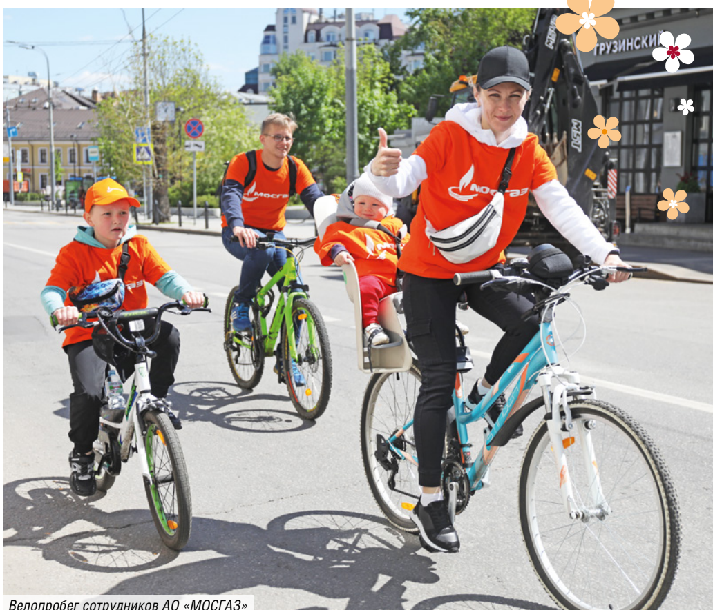
Велопробег сотрудников АО «МОСГАЗ»

А всего многодетных семей в Москве за последние десять лет стало втрое больше — свыше 200 тысяч. Ощутимое достижение, который наглядно свидетельствует о росте качества жизни и укреплении традиционных семейных ценностей в столице.