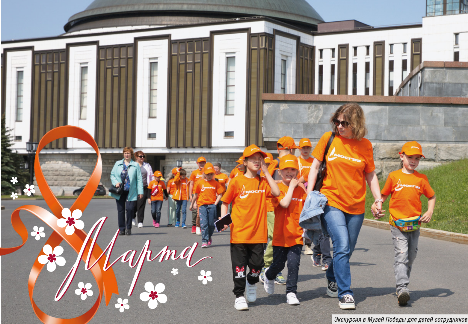
Экскурсия в Музей Победы для детей сотрудников