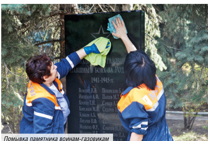
Помывка памятника воинам-газовикам