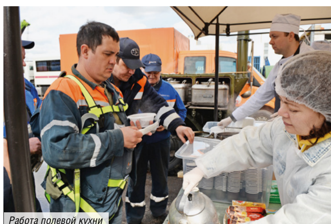
Работа полевой кухни

Команда специалистов с помощью автовышек провела тщательный осмотр газовых фонарей: проверили целостность каменных колпачков. Также столичные газовики провели техническое обслуживание и чистку деталей для обеспечения оптимального качества освещения. А завершился процесс промывкой и чисткой деталей фонарей, которые теперь будут светить ярче, радуя сотрудников предприятия и гостей центрального офиса своим теплым атмосферным светом. Уход за такими объектами — задача непростая, и мосгазовцы всегда подходят к ее выполнению с особой ответственностью.