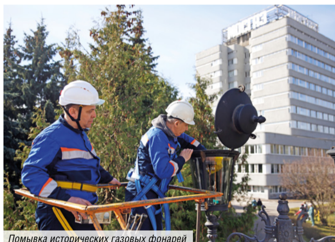
Помывка исторических газовых фонарей