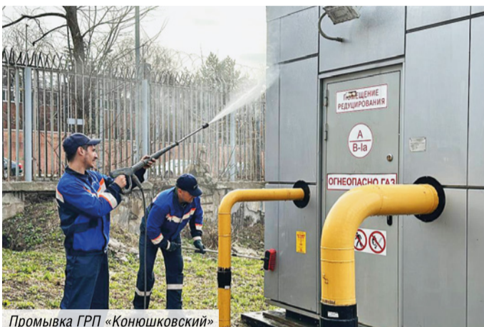
Промывка ГРП «Конюшковский»