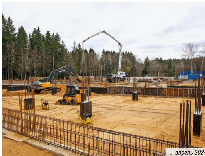
... апрель 2024

Для достижения этих целей создаются новый комплекс в поселке Армейский и инновационный центр сварки в составе газорегуляторного комплекса «Карачарово».