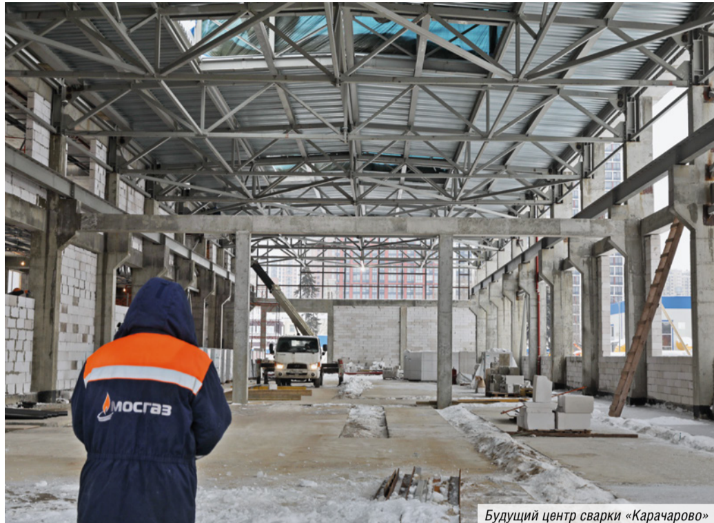
Будущий центр сварки «Карачарово»