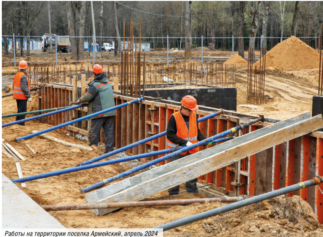
Работы на территории поселка Армейский, апрель 2024