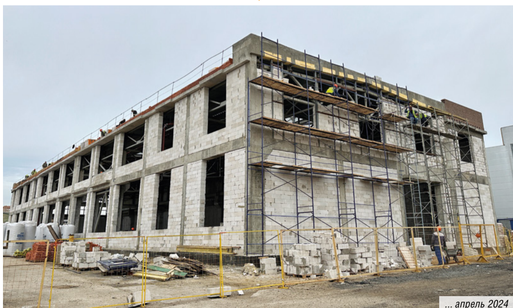
... апрель 2024