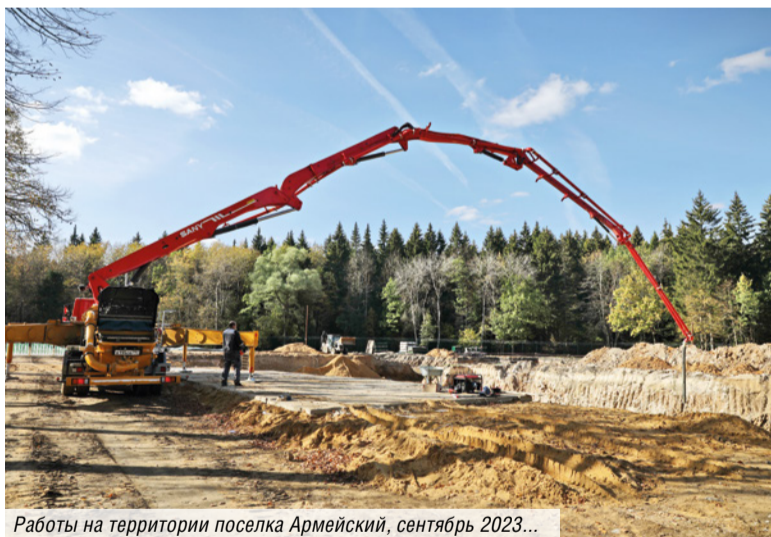
Работы на территории поселка Армейский, сентябрь 2023...

МОСГАЗ продолжает стратегическое расширение, одним из важных направлений станет повышение операционной эффективности в ТиНАО. Масштаб задач и растущий объем производства требуют также постоянного развития командных компетенций и квалификации сварщиков.