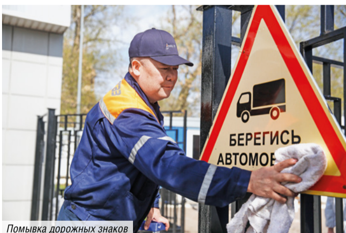
Помывка дорожных знаков