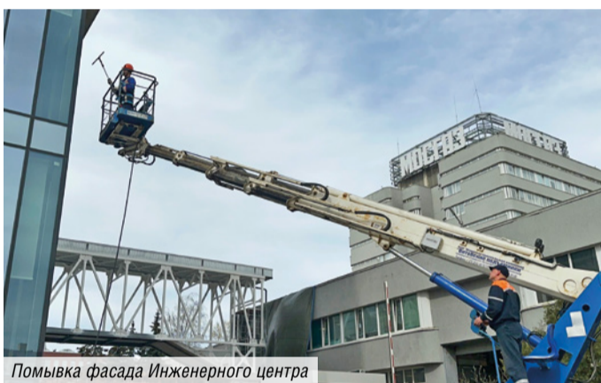
Помывка фасада Инженерного центра