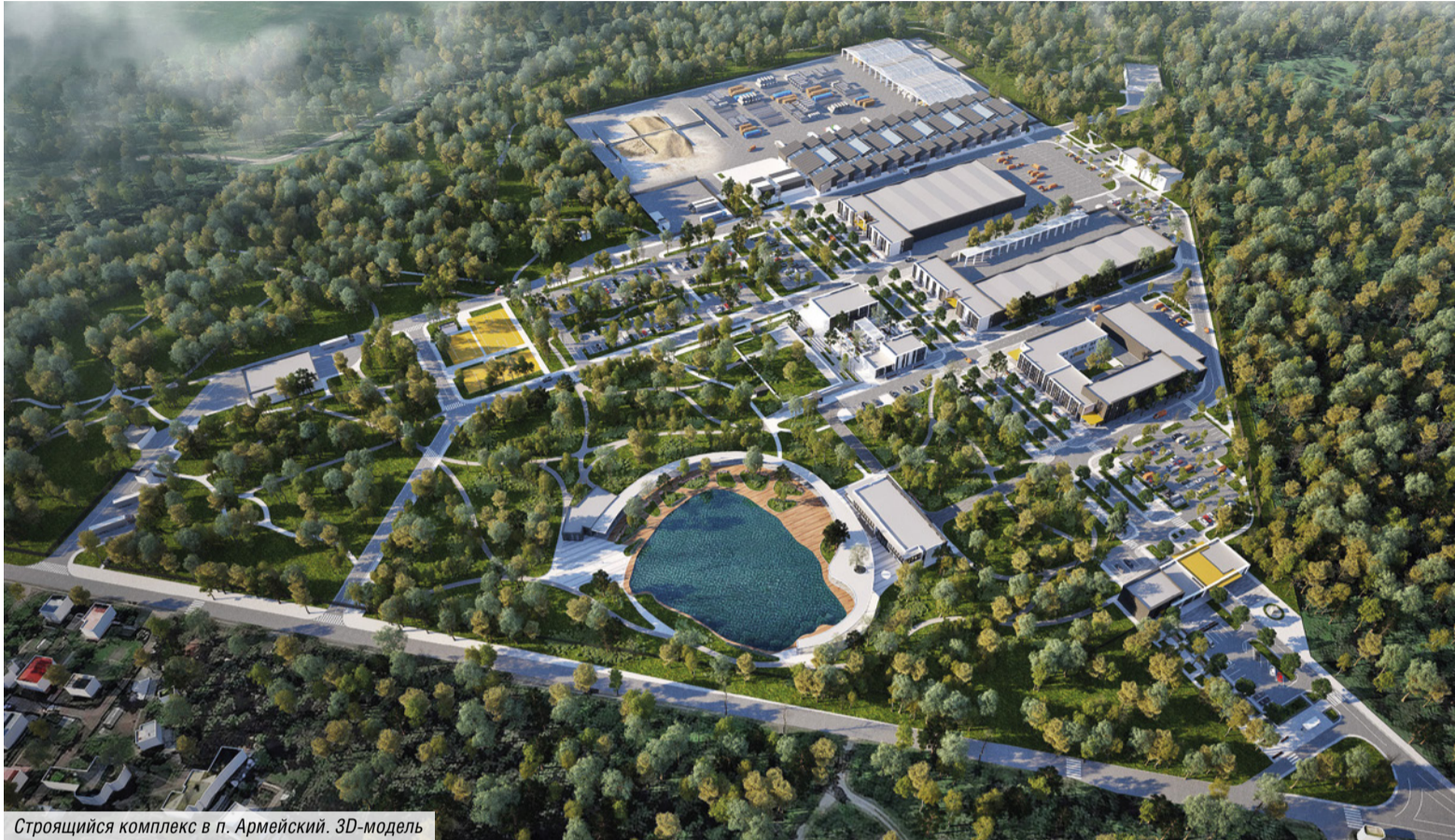
Строящийся комплекс в п. Армейский. 3D-модель