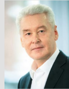
Мэр Москвы Сергей Собянин

«Начал работу Московский урбанистический форум. Это площадка для обсуждения перспектив развития крупных городов. Помимо деловой программы, горожан ждут культурные и спортивные мероприятия. В Лужниках покажут достижения города в самых разных сферах: цифровых технологиях, городском хозяйстве и благоустройстве, промышленности, культуре».