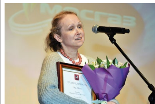
НАГРАЖДЕНИЕ СОТРУДНИКОВ АО «МОСГАЗ» КО ДНЮ РАБОТНИКОВ НЕФТЯНОЙ И ГАЗОВОЙ ПРОМЫШЛЕННОСТИ