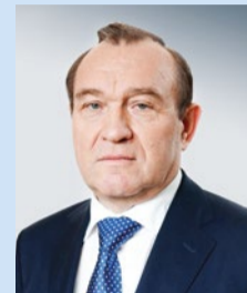
Заместитель Мэра Москвы Петр Бирюков