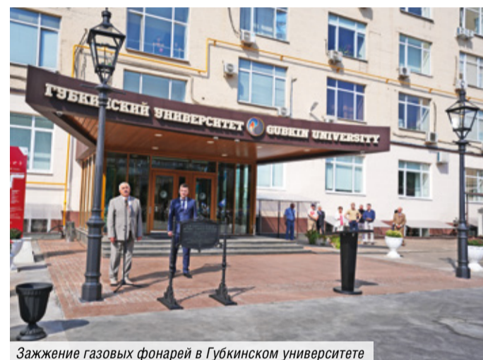
Зажжение газовых фонарей в Губкинском университете