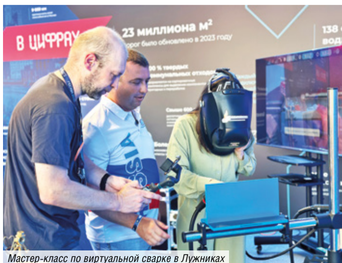
Мастер-класс по виртуальной сварке в Лужниках