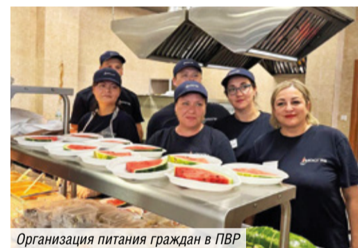
Организация питания граждан в ПВР

Лучший способ набраться сил, поправить здоровье — хорошее питание. «Меню каждый день новое, разнообразное: первое, второе, десерты, фрукты. Используем полевые кухни, готовим кашу, варим компот, чай.