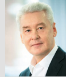
Мэр Москвы Сергей Собянин

«То, что вы сделали в городе за последние годы, действительно сделало наш город одним из самых лучших в мире и любимым горожанами. Поэтому работников комплекса городского хозяйства, которые это сделали своими руками, конечно, любят наши горожане».