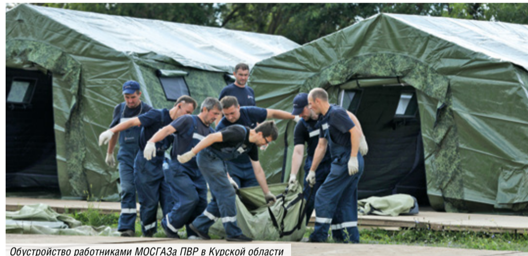
Обустройство работниками МОСГАЗа ПВР в Курской области

Вторжение врага в Курскую область 6 августа до глубины души потрясло Россию. На выручку людям, покинувшим свои дома в приграничье, пришла вся страна. Кто скоро помог, тот дважды помог, говорят на нашей земле. Столица одной из первых откликнулась на боль курян. Сначала в регион отправились московские медики, вслед за ними — специалисты Комплекса городского хозяйства, в том числе и мосгазовцы. Нас вело чувство плеча, чувство Родины. Ведь Родина — это все мы.