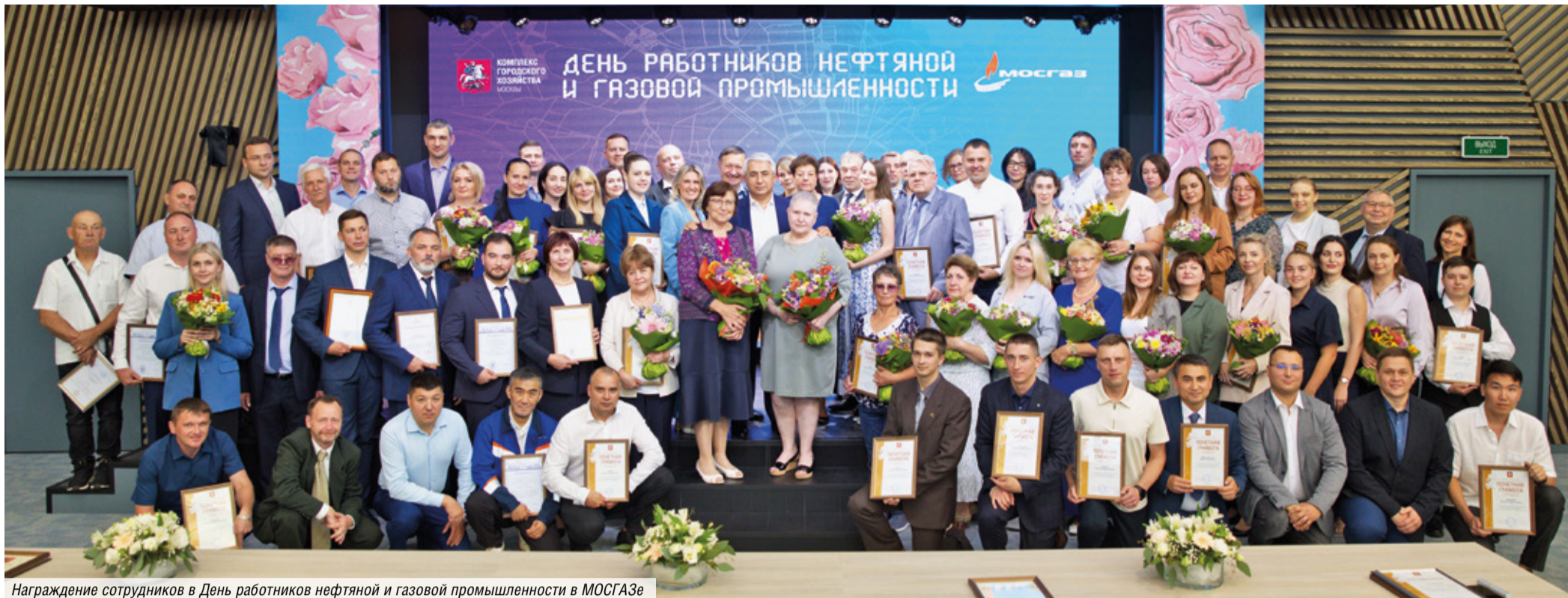
Награждение сотрудников в День работников нефтяной и газовой промышленности в МОСГАЗе