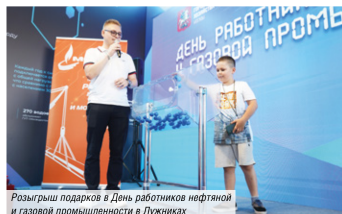
Розыгрыш подарков в День работников нефтяной и газовой промышленности в Лужниках