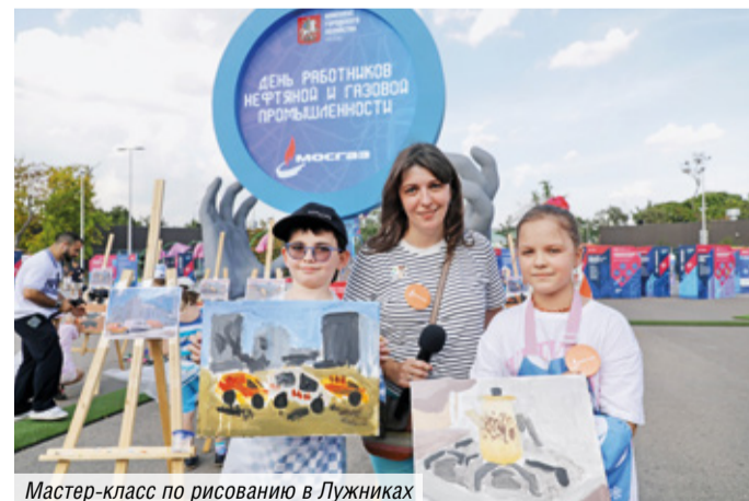
Мастер-класс по рисованию в Лужниках

На тематическом мастер-классе по живописи с профессиональным художником ребята создавали рисунки о работе столичных газовиков, а точнее, образы объектов газового хозяйства Москвы, какими они их видят сегодня и то, каким они представляют их себе в будущем.