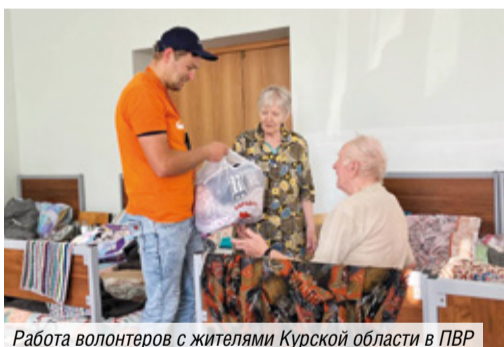
Работа волонтеров с жителями Курской области в ПВР