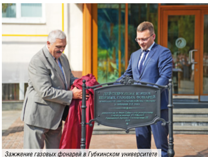
Зажжение газовых фонарей в Губкинском университете