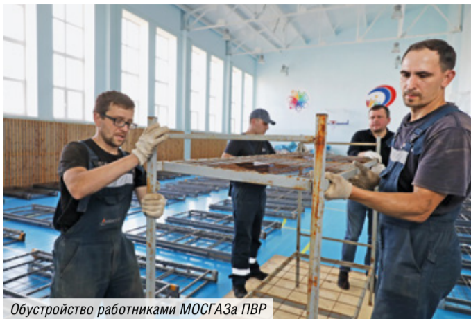
Обустройство работниками МОСГАЗа ПВР