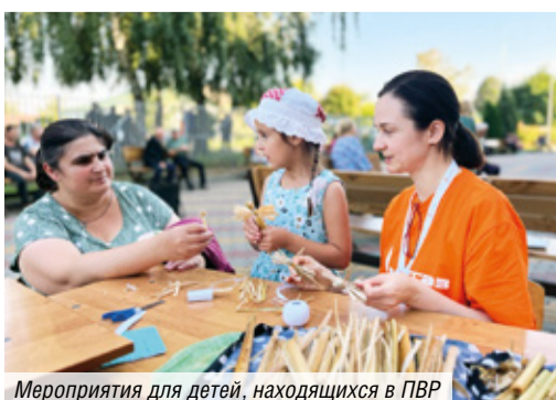
Мероприятия для детей, находящихся в ПВР

Вторжение врага в Курскую область 6 августа до глубины души потрясло Россию. На выручку людям, покинувшим свои дома в приграничье, пришла вся страна. Кто скоро помог, тот дважды помог, говорят на нашей земле. Столица одной из первых откликнулась на боль курян. Сначала в регион отправились московские медики, вслед за ними — специалисты Комплекса городского хозяйства, в том числе и мосгазовцы. Нас вело чувство плеча, чувство Родины. Ведь Родина — это все мы.