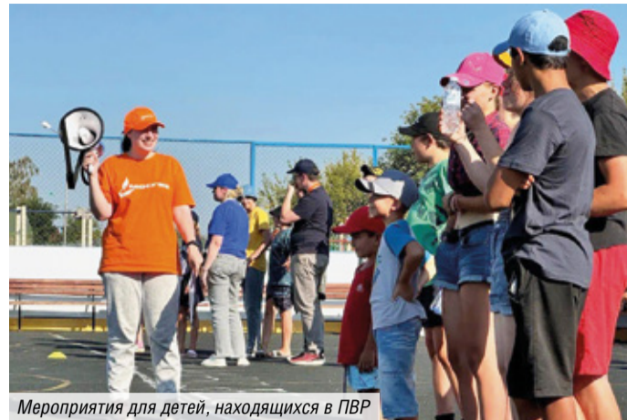
Мероприятия для детей, находящихся в ПВР