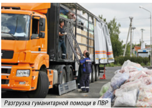
Разгрузка гуманитарной помощи в ПВР