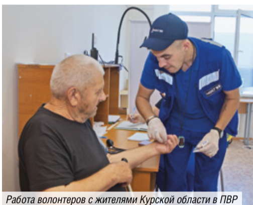
Работа волонтеров с жителями Курской области в ПВР