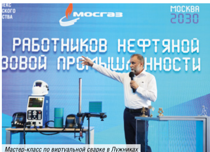
Мастер-класс по виртуальной сварке в Лужниках

Накануне праздника в МОСГАЗе состоялась церемония награждения сотрудников почетными грамотами, благодарностями и благодарственными письмами Министерства энергетики РФ, Министерства строительства и ЖКХ РФ, мэра Москвы, Департамента жилищно-коммунального хозяйства города Москвы и АО «МОСГАЗ». Всего награды получили более 60 работников МОСГАЗа.