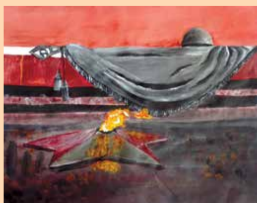
1-е место – Вельк Юлия