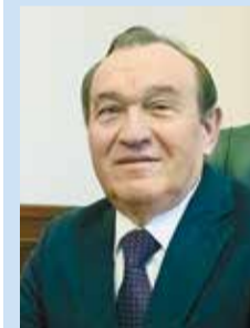
Заместитель Мэра Москвы Петр Бирюков

9 Мая – это праздник жизни и торжество исторической памяти, праздник любви к нашей Родине – к России. Праздник, который вселяет в нас гордость за великие свершения предков и уверенность в своих силах».