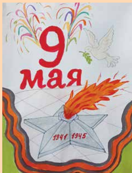
2-е место – Климов Марк