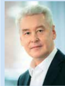
Мэр Москвы Сергей Собянин