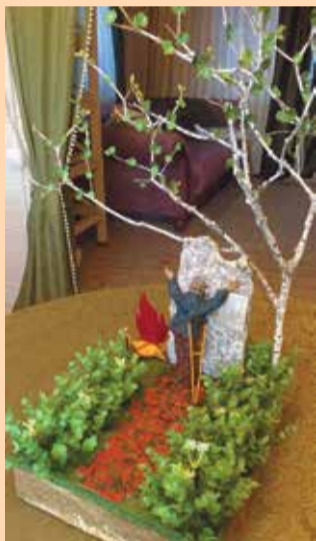
1-е место – Козлова Юлия