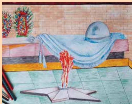
3-е место – Полянская Елизавета