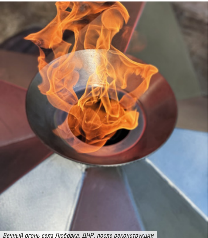
Вечный огонь села Любовка, ДНР, после реконструкции