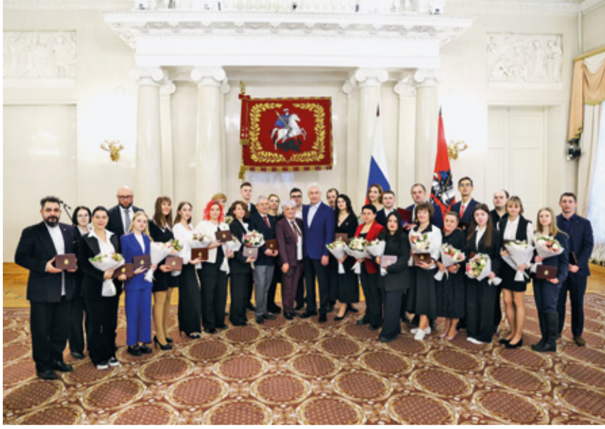
СОТРУДНИК АО «МОСГАЗ» НАГРАЖДЕН ЗНАКОМ ОТЛИЧИЯ «ВОЛОНТЕР МОСКВЫ»