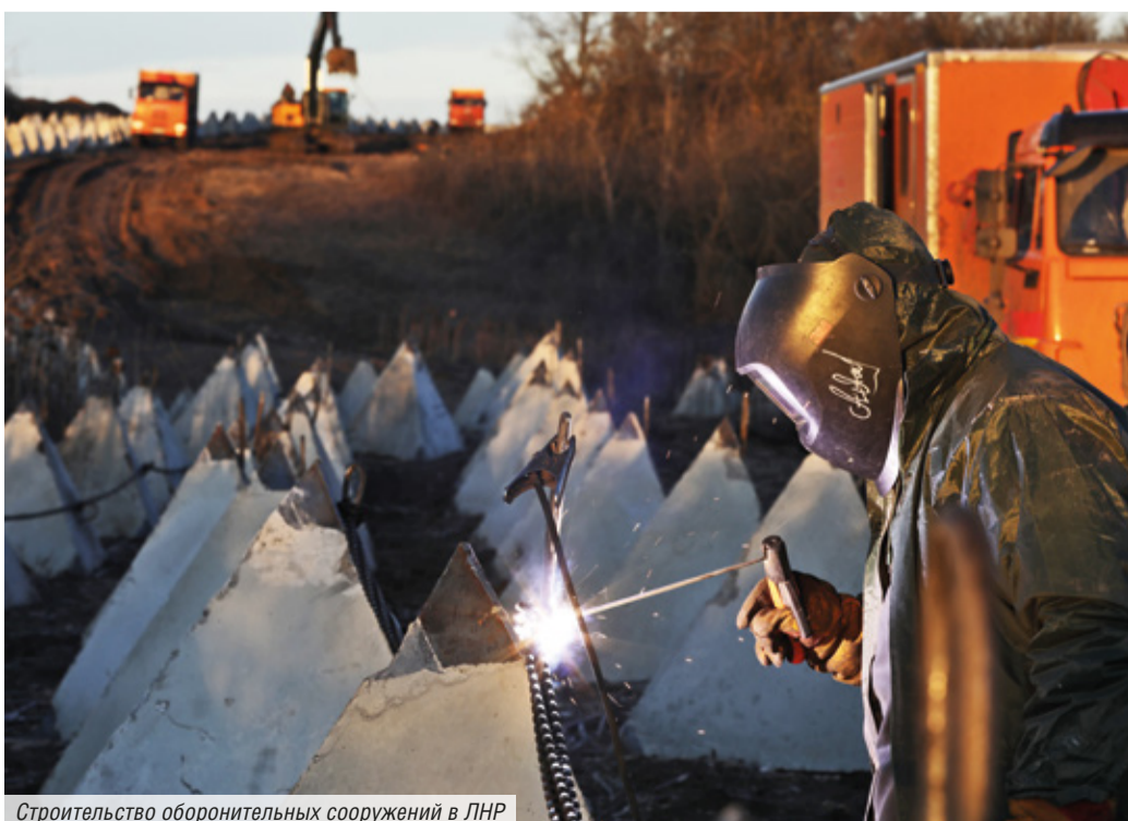
Строительство оборонительных сооружений в ЛНР

С Днем защитника Отечества, дорогие мосгазовцы! С вами — мы, Москва, вся страна!