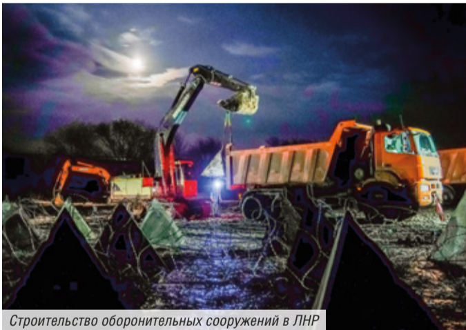
Строительство оборонительных сооружений в ЛНР