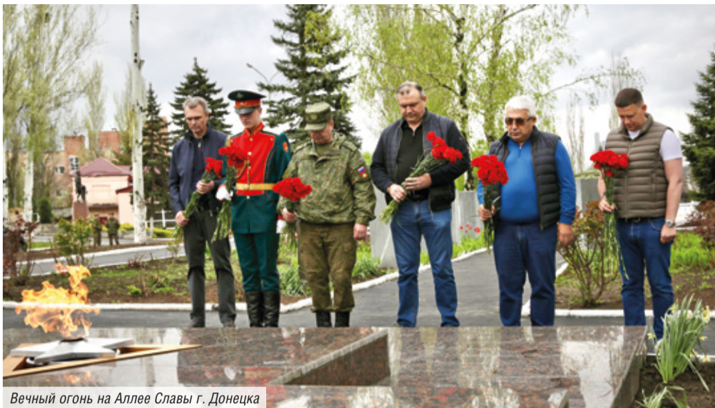
Вечный огонь на Аллее Славы г. Донецка