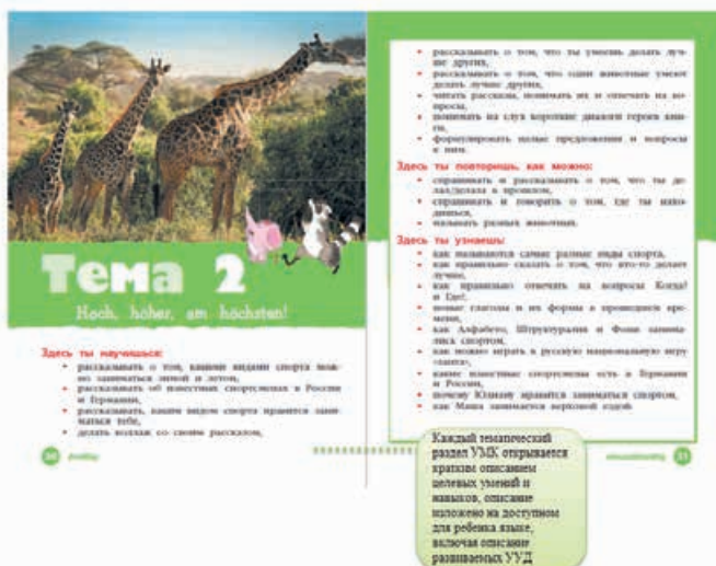
Схема 5. Пример вводной страницы

Каждый тематический раздел УМК открывается кратким описанием целевых умений и навыков, описание изложено на доступном для ребёнка языке, включая описание развиваемых УУД. Пример вводной страницы к теме 2 дан на схеме 5.