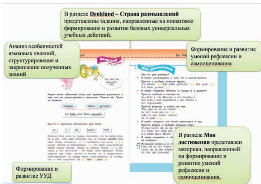
Схема 3. Пример построения раздела Denkland (Страна размышлений) и Мои достижения

Разделы Wanderland – Страна путешествий , данные после темы 4 и темы 8, направлены на поддержание принципа дифференциации, а также на реализацию познавательных мотивов школьников. Кроме того, материалы этого раздела могут быть использованы в качестве базовых для выполнения проектной работы и для проведения комплексных занятий по реализации межпредметных связей во внеурочное время. Задания этих разделов содержат как собственно учебный материал (в том числе и лингвострановедческого характера), так и дополнительные тексты познавательного характера из разных предметных областей (см. пример на схеме 4).