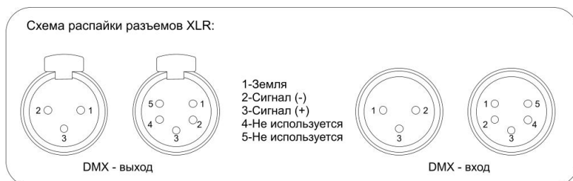
Схема распайки разъемов:

При подключении устройства в режиме Master/Slave, количество приборов в цепи не должно превышать 32 шт. Максимальная рекомендованная дистанция цепи – 500 м.