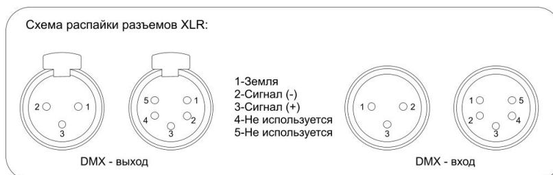
Схема распайки разъемов:

При подключении устройства в режиме Master/Slave, количество приборов в цепи не должно превышать 32 шт. Максимальная рекомендованная дистанция цепи – 500 м.