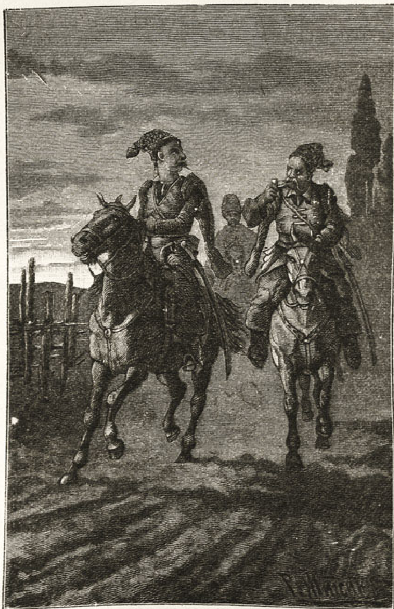
Было давно подъ вечеръ, когда выѣхали они въ поле. (Стр. 9).