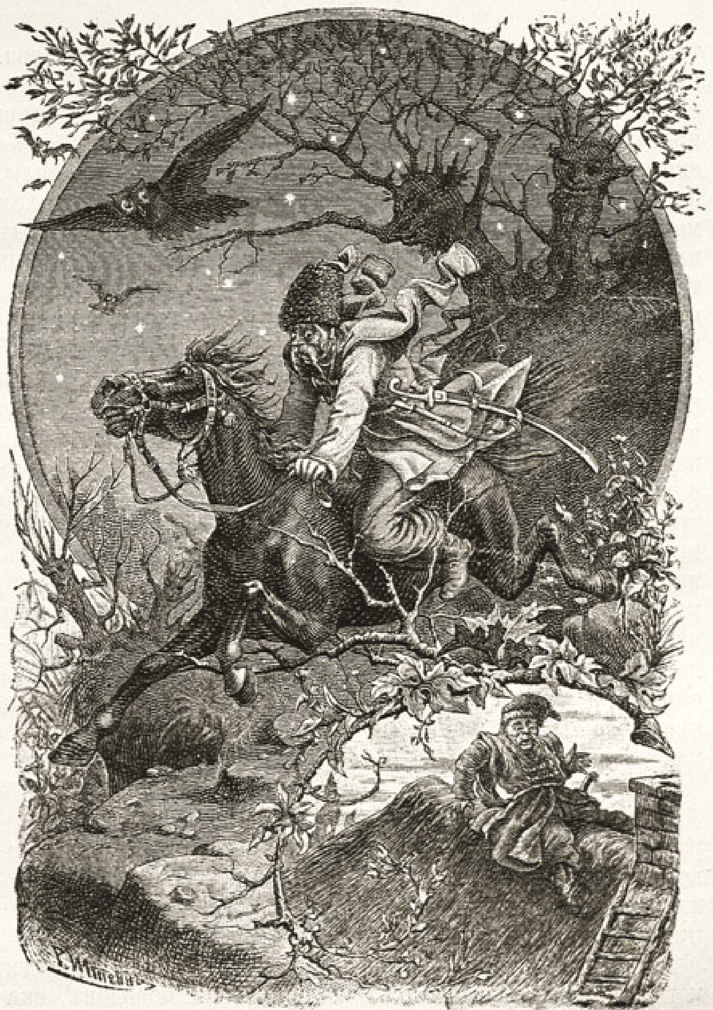
Конь, не слушаясь ни крику, ни поводовъ, скакаль черезъ провалы и болота. (Стр. 24).