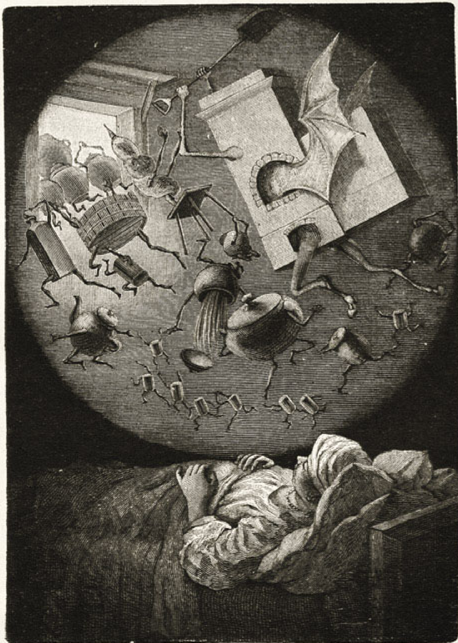
Печь ъздила по хатѣ, выгоняя вонъ лопатою горшки, лоханки... (Стр. 26).