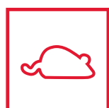
НЕ ЕДЯТ ГРЫЗУНЫ