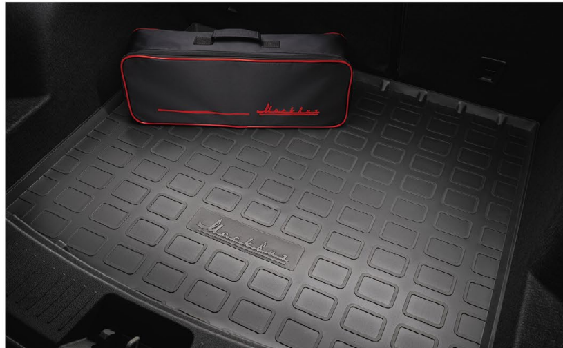
Поддон в багажник