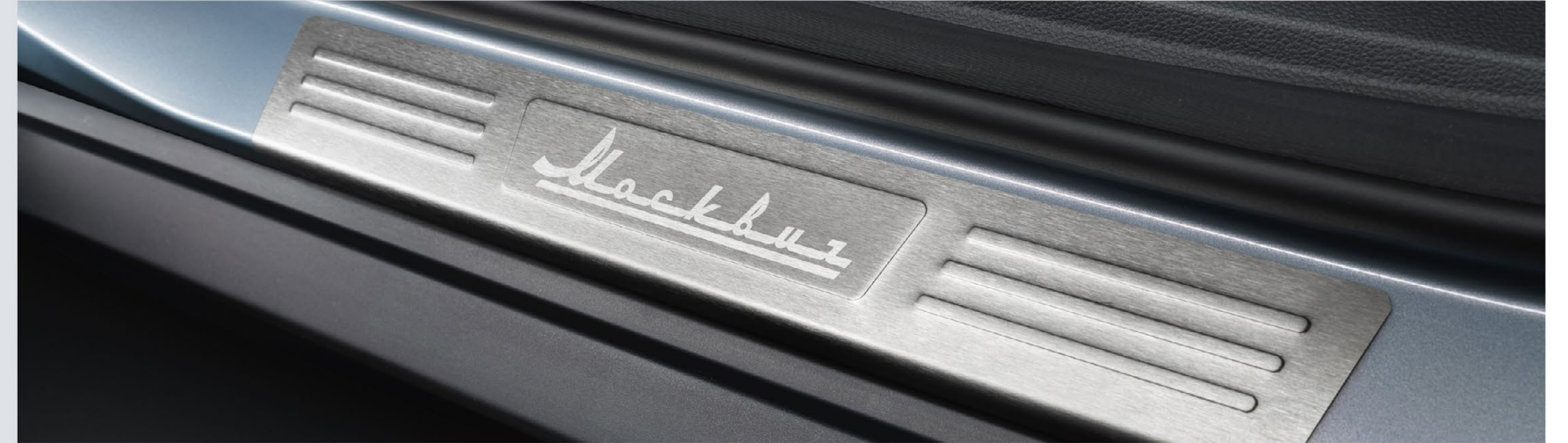
Накладки на пороги