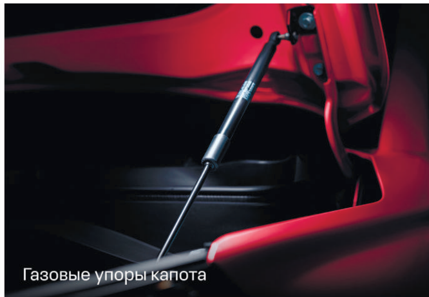
Газовые упоры капота