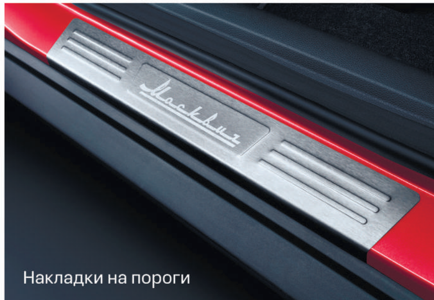
Накладки на пороги