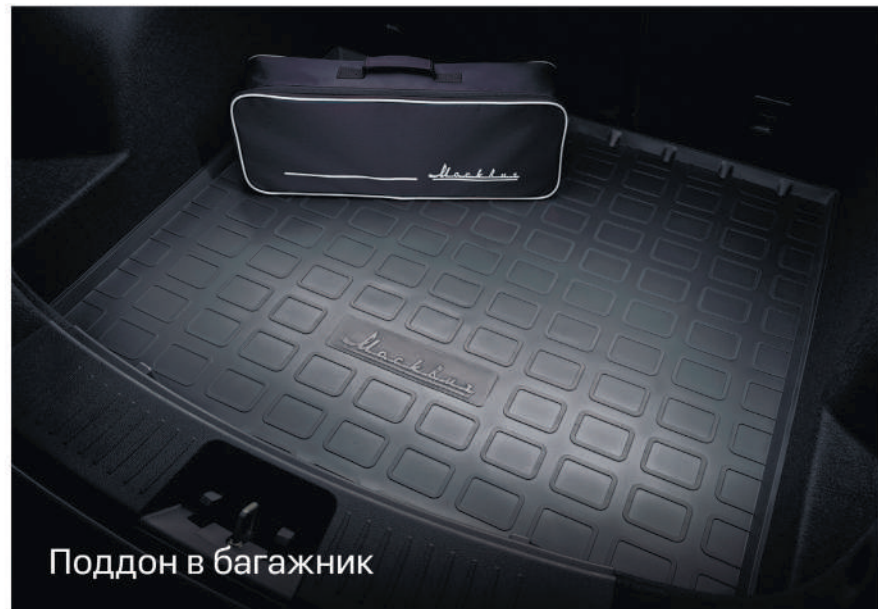
Поддон в багажник