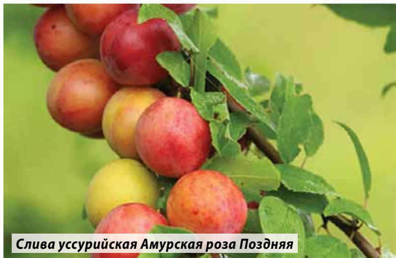
Слива уссурийская Амурская роза Поздняя

у сливы китайской – побеги и листья без опушения, цветки – по три в почке.