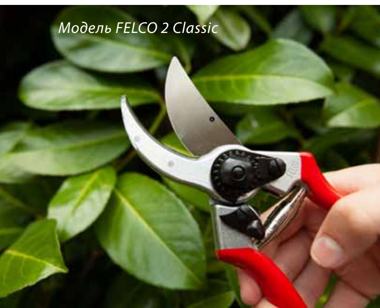
Модель FELCO 2 Classic

Но, как вы понимаете, главное, чтобы секатор был острым. Ведь то, что мы сейчас делаем в саду, сродни хирургическим операциям: мы удаляем, укорачиваем, надрезаем, зачищаем. И естественно, что после любой такой операции остаются болезненные раны. Будете делать обрезку некачественным, тупым, плохо отрегулированным инструментом, болезни вашим деревьям гарантированы! Тупой инструмент не разрезает ткань, а мнет ее и давит, оставляет заусеницы, из-за чего нанесенная растению во время операции рана зарастает медленно, а из-за заусениц может не зажить никогда.