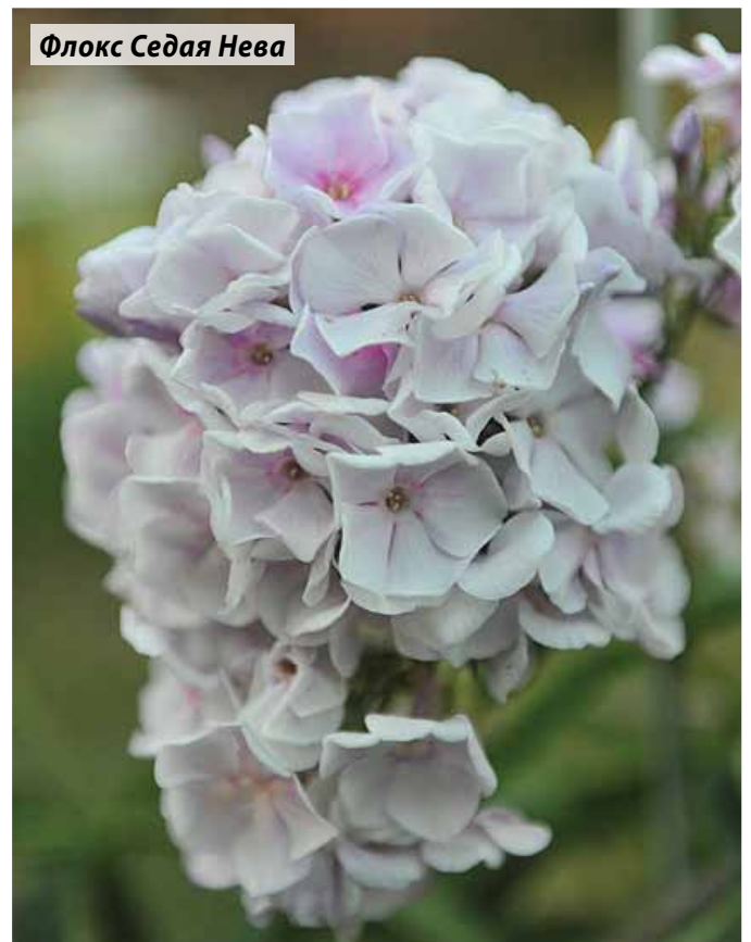
Флокс Седая Нева

ГОРИЦВЕТ – диаметр 4,2 см, высота 90 см. Очень яркий, оранжево-красный, с маленьким пурпурным колечком и светлыми лучиками, расходящимися от центра. Соцветие крупное.