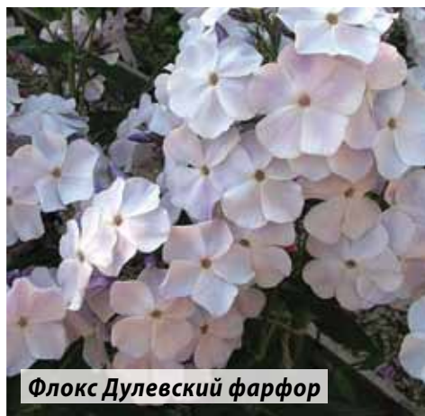
Флокс Дулевский фарфор