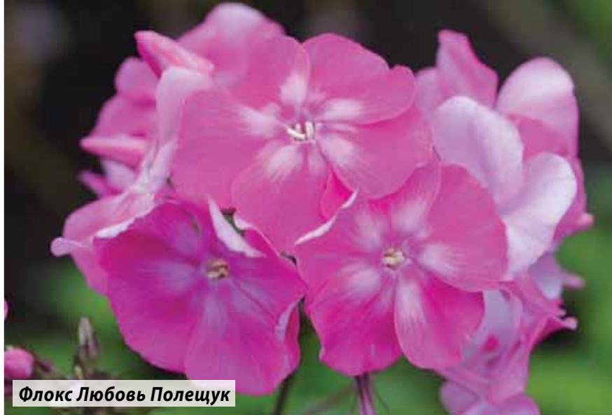
Флокс Любовь Полецук

В Ботаническом саду-институте под Владивостоком сформирован сортимент флоксов отечественной и зарубежной селекции, происходящих от трех видов, разных сроков цветения, окраски и габитуса.