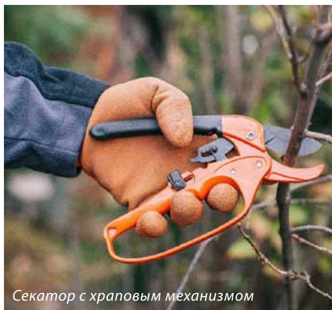
Секатор с храповым механизмом