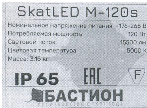
Светодиодный светильник SkatLED M-120s